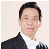
关贵敏，著名男高音歌唱家，中国“歌王”。