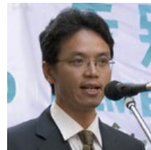
陈用林，原中共驻悉尼领馆负责监控法轮功的外交官。