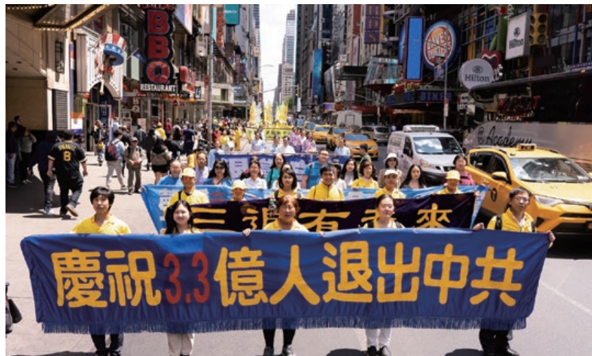
2019年5月16日，万名法轮功学员美国纽约大游行。

有人可能说“自己心中退党就算退了，不必声明”；还有人认为“自己多年没交党费了，就算自动退党了”；或者认为“年龄大了，已经自动退团、退队了”。但这都无法解除加入中共时发下的毒誓。而天灭中共时，没有解除这个毒誓的人，就将成为中共的陪葬。只有采取公开的方式退出，有行为的表示，才能解除那个“毒誓”。神看人心，只要真心声明“三退”，用真名、化名、小名皆可。