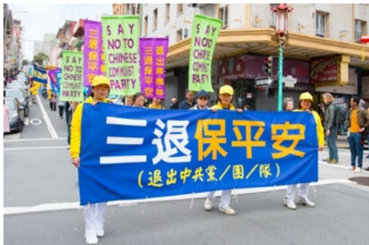
美国北加州退党服务中心在旧金山游行，声援三亿人三退。

当上天要灭它时，当然会连带它的成员——党员、团员、队员。所以退出中共组织，是表明自己不与邪恶为伍，是避免天灭中共时受到连累。这样说来，劝您“三退”的人，那是真心为您的平安着想，真心为您好，却不图您的一分钱。