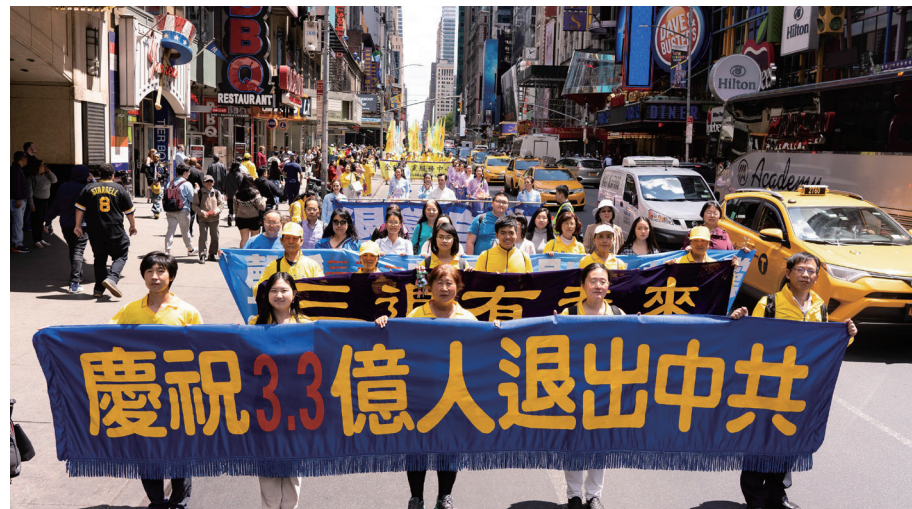
2019 年 5 月 16 日，万名法轮功学员美国纽约大游行。

1992 年和 1993 年的北京东方健康博览会上，法轮功被誉为“明星功派”，获得“边缘科学进步奖”，李洪志先生荣获“受群众欢迎气功师”称号。