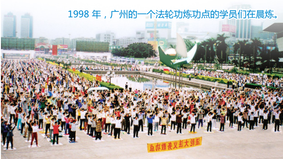
1998 年，广州的一个法轮功炼功点的学员们在晨炼。

法轮功自 1992 年 5 月 13 日由李洪志先生从中国长春传出，以简单明白的法理和祛病健身的奇效吸引了无数有识之士，至今已弘传世界 100 多国和地区。李洪志先生和法轮大法因对人类身心健康做出的杰出贡献，获各国政府褒奖、支持议案、支持信函 3600 多项(上图)。