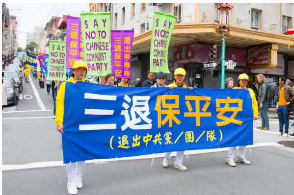
美国北加州退党服务中心在旧金山游行，声援三亿人三退。

当天要灭它时，当然会连带它的成员——党员、团员、队员。所以退出中共组织，是表明自己不与邪恶为伍，是避免天灭中共时受到连累。这样说来，劝您“三退”的人，那是真心为您的平安着想，真心为您好，却不图您的一分钱。