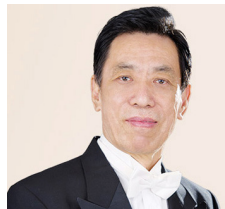
关贵敏，著名男高音歌唱家，中国“歌王”。