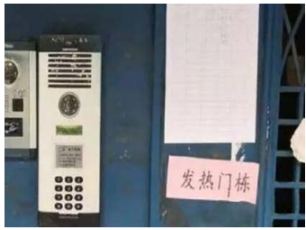
예전의 백보정“만가연(万家宴)” 현재 백보정 사회구역은 발열구역

무한의 네티즌 장씨는 “정부는 백보정을 직접 버렸습니다. 현지 관리자는 혹 자신의 권직에 영향줄까 두려워 아예 그들에게 폐쇄 조치내리고 그들을 내버려 뒀습니다. 그 구역에는 9개 단지가 있는데 매개 단지에는 4000개 가정이 포함 돼 있습니다. 그럼에도 불구하고 하루에 딱 한명의 확진자만 확보 하라고 합니다.