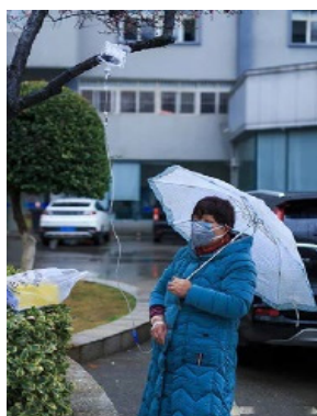
한양병원, 갈 곳이 없어 환자는 길가에서 링거를 받고있다

한 인터넷 매체가 최근에 거래하는 대륙의 두 기업에서 얻은 소식에 따르면 중국의 많은 방직관련공장은 이미 외부의 오다를 받지 않는다. “옷을 제작하지 않고, 마스크도 제작하지 않고, 정부에서 요구하는 ‘시체주머니’만 제작하고있다.” 고 폭로 했다. 이외 일부 기업은