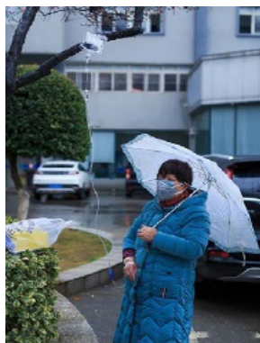
한양병원, 갈 곳이 없어 환자는 길가에서 링거를 받고있다

한 인터넷 매체가 최근에 거래하는 대륙의 두 기업에서 얻은 소식에 따르면 중국의 많은 방직관련공장은 이미 외부의 오다를 받지 않는다. “옷을 제작하지 않고, 마스크도 제작하지 않고, 정부에서 요구하는 ‘시체주머니’만 제작하고있다.” 고 폭로 했다. 이외 일부 기업은