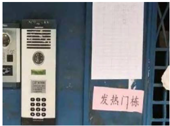
예전의 백보정“만가연(万家宴)” 현재 백보정 사회구역은 발열구역

무한의 네티즌 장씨는 “정부는 백보정을 직접 버렸습니다. 현지 관리자는 혹 자신의 권직에 영향줄까 두려워 아예 그들에게 폐쇄 조치내리고 그들을 내버려 뒀습니다. 그 구역에는 9개 단지가 있는데 매개 단지에는 4000개 가정이 포함 돼 있습니다. 그럼에도 불구하고 하루에 딱 한명의 확진자만 확보 하라고 합니다.