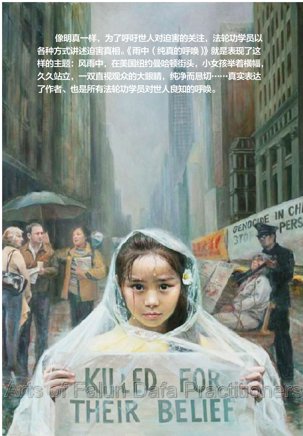
绘画：《雨中（纯真的呼唤）》

像明真一样，为了呼吁世人对迫害的关注，法轮功学员以各种方式讲述迫害真相。《雨中（纯真的呼唤）》就是表现了这样的主题：风雨中，在美国纽约曼哈顿街头，小女孩举着横幅，久久站立，一双直视观众的大眼睛，纯净而恳切……真实表达了作者、也是所有法轮功学员对世人良知的呼唤。