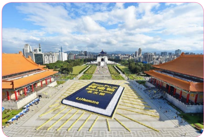
2018 年 11 月 24 日，约 5400 名法轮功学员于台北自由广场排出巨幅的英译本《转法轮》。

为什么一本书会有如此强大的力量？吸引那么多人来学，而且是一家一家地来学。我们听一下简森·古德林女士怎么说。