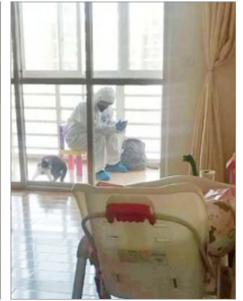
习近平3月10日到武汉视察，为了防止市民喊出真话，警察入户。图为当地居民拍摄的照片：中央领导来了，警察在我们家阳台上，不让我们靠近阳台。