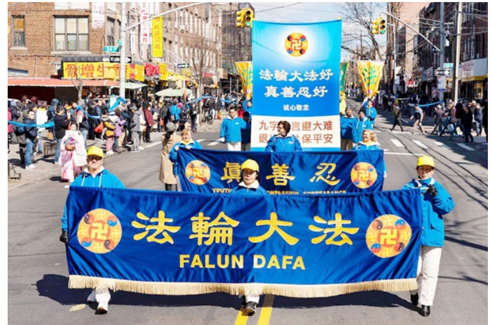
2020年3月1日，法轮功学员在纽约华人社区游行，传递救世良方，条幅引人注目：九字真言避大难，退出中共保平安。

末年，都伴随着灾疫，给腐朽政权送终。与腐朽政权为伍，何谈正气？其实是在逆天而行。中国5000年，中共70年，中国不是中共。中共建政后不断发动运动，造成8000万中国人非正常死亡，它又残酷迫害信仰“真善忍”的法轮功学员，甚至活体摘取器官牟利，天理不容。天灭中共是天意，入过党团队的人，是中共的一页，就跟着遭殃。你退出，就平安了。已有3.5亿中国人在海