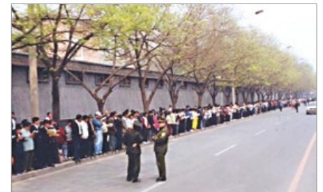
1999 年 4 月 25 日上访现场秩序井然，警察不用维持秩序，在一旁聊天。

最后，终于由警察殴打及非法抓捕 40 多名法轮功学员的天津事件，引发 1999 年 4 月 25 日