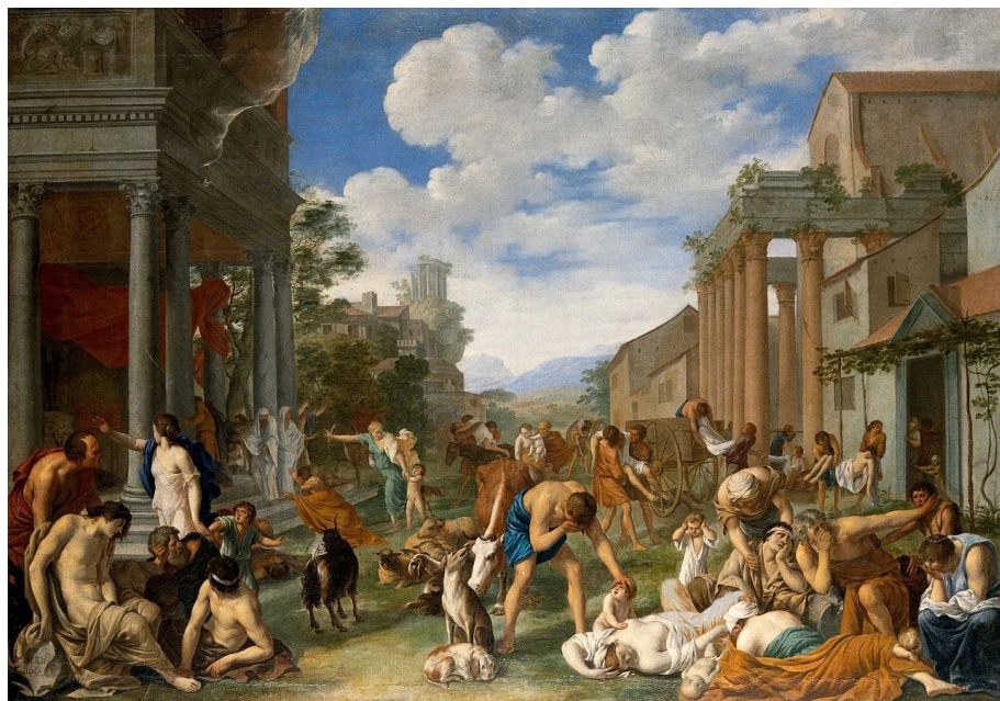
《非利士人在阿什杜德的瘟疫》(The plague of the Philistines at Ashdod)