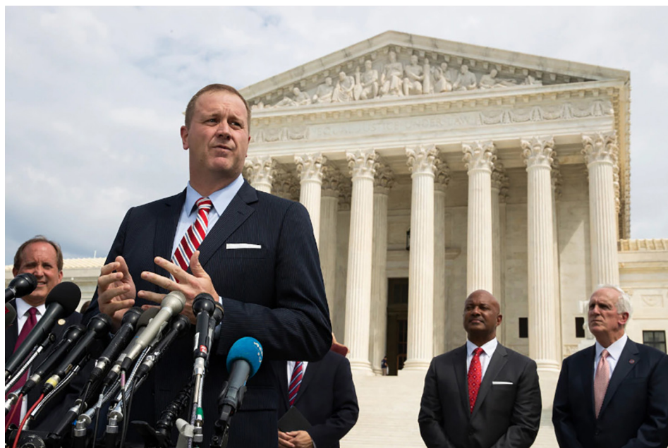
美国密苏里州 4 月 21 日起诉中共，要求中共对疫情造成的损失进行赔偿。

4 月 21 日，美国密苏里州就中共隐瞒疫情带来的严重后果，起诉中共。诉讼要求中共就其隐瞒疫情而造成的巨大生命损失，人类痛苦和经济动荡进行赔偿。密苏里州成为美国首个对中共进行起诉的州。