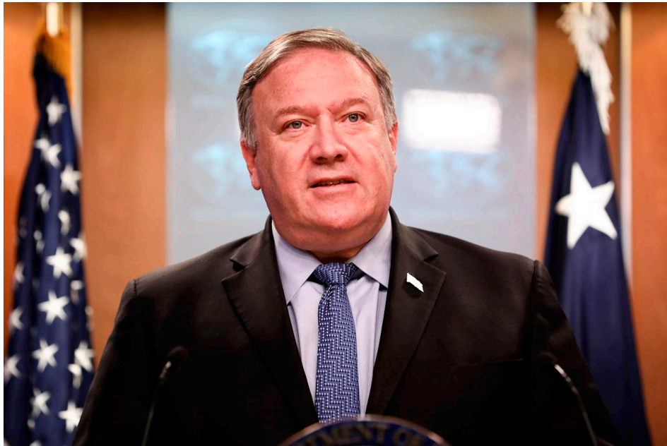
蓬佩奥表示，中共仍在隐瞒，让人的生命处于危险之中。

美国国务卿蓬佩奥强调：“受中共虚假信息、掩盖真相伤害最大的人，是中国湖北人、武汉人。”