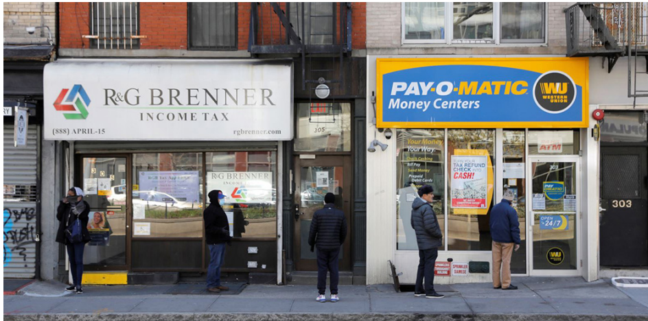
2020年4月2日，人们进入纽约市一家支票兑现公司。

目前仍在全球蔓延的武汉肺炎疫情，中国的“老朋友”美国如何应对？俗话说：不比不知道，一比吓一跳。