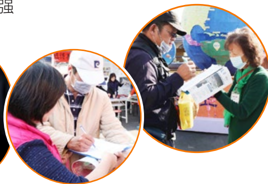
民众签名声援法轮功学员反迫害