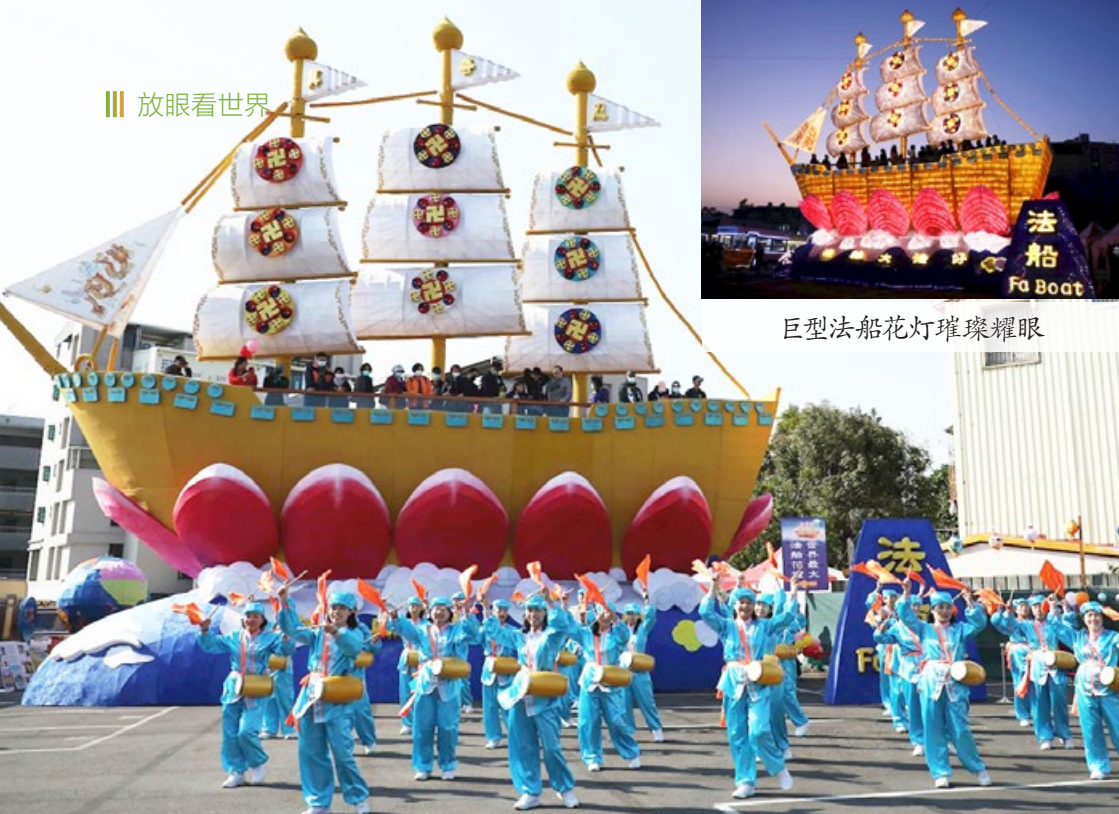
巨型法船花灯璀璨耀眼