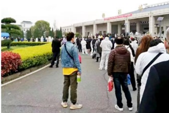
2020 年 3 月 26 日早上, 汉口殡仪馆领骨灰长长的队伍。