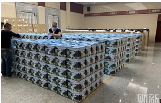
2020 年 3 月 26 日, 汉口殡仪馆工作人员把大货车上成堆的骨灰盒搬到静雅厅的侧厅存放。