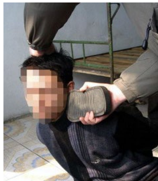
酷刑演示：鞋底打脸