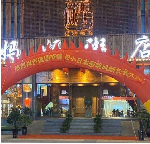
沈阳杨妈妈粥店打出的庆祝美国、日本疫情的横幅

中共的防火墙和删帖大军屏蔽和删掉了对美国疫情的正确报道，却任由“网络流氓”在网上狂欢。