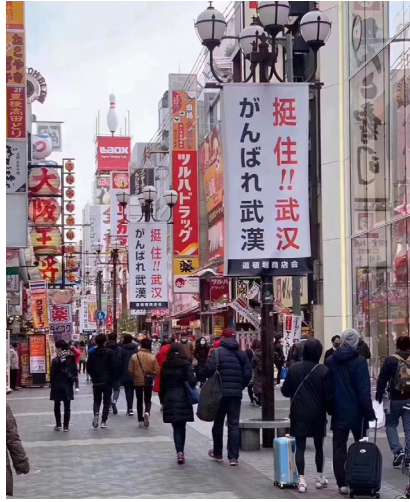
日本支持武汉的横幅

3月12日，从中共外交部发言人公开在推特上叫嚣“武汉肺炎病毒是美军带入”开始，成千上万的“网络评论员”（又称“五毛党”）甩锅美国。武汉肺炎攻击的是人们的身体，而舆论暴力却在吞噬中国人的心灵。