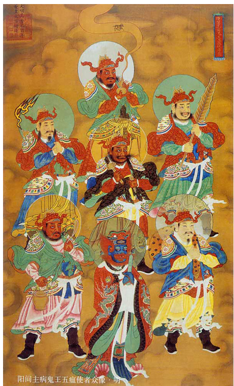
主病鬼王五瘟使者众像

在传统文化中有着对各种神明的敬仰，河神、山神、雷神、土地神等等，他们掌管着天地间万事万物。