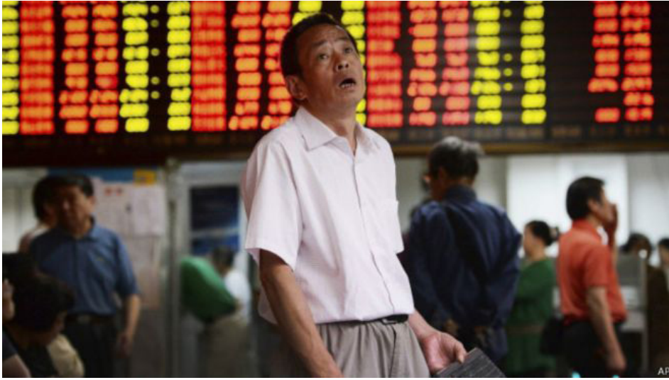
股市崩盘后血本无归的股民

7月6日晚，“新闻联播”用了1分12秒的时间报导了大陆A股大涨的消息，称中国经济复苏和股市上涨的最大动能是“出色的疫情防控能力与防控成绩”。