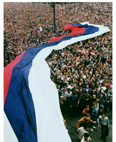
1991年8月22日，约100万民众在莫斯科庆祝推翻前苏联共产党。