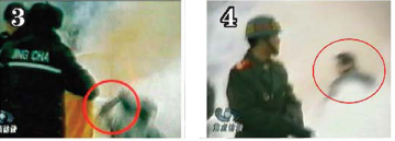
刘用手触摸被击打部位，随之倒地。