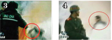
刘用手触摸被击打部位，随之倒地。