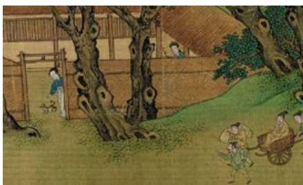
婆婆的儿子回来了