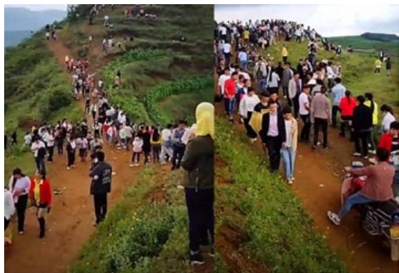
贵州秀水镇山谷连续几天传出奇怪叫声，引发不少人到此围观。