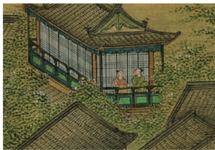
朱生向店主打听情况

朱生听了也感到悲恻，就向店主仔细询问了婆媳两人的家世和儿子的姓名、年龄、相貌。朱生回到房里，把二百两银子全部拿出来，又以婆婆儿子的名义写了一封假信，带了去到婆媳的家。朱生对婆婆说：“我去川中贩货，与你的儿子是莫逆之交。今天运货南归，你儿子嘱咐我把银子和信带来，请你收下。”婆婆高兴得不得了，想留朱生坐一下，朱生借口要赶路，就告辞而去。绕道回到客栈，给自己家里写了封信，借口被盗，请缓婚期，自己就