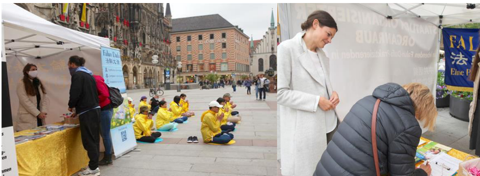
사람들이 파룬궁 반박해에 성원하기 위해 서명하다 .

마린엔 광장에서 노란색 상의를 입은 파룬궁 수련생들이 느슨한 연공 음악과 함께 파룬궁 공법을 시연하면서 독일어로 설명하자 , 시민들이 관심을 보였다 . 일부 사람들은 걸음을 멈추고 조용히 구경했고 , 어떤 사람은 파룬궁 진상 보드를 구경하며 자료를 요구하기도 했고 , 또 어떤 사람은 자료가 비치된 부스를 찾아가 파룬궁 수련생들의 반박해를 성원하는 서명을