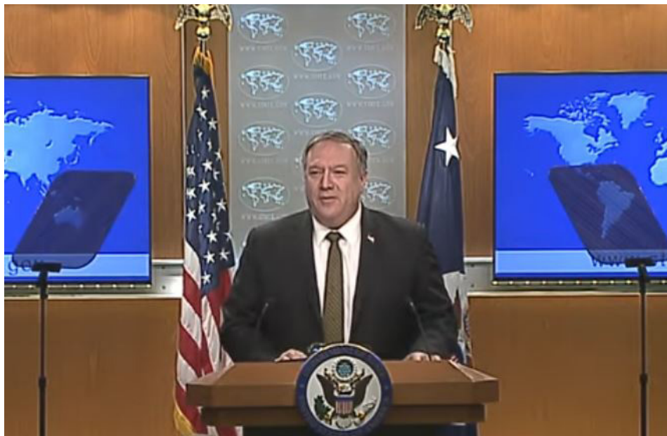
2020 년 6 월 10 일 , 미국 국무부에서 2019 년 ‘국제종교자유보고’ 를 발표했다 . 폼페이오 장관은 당일 기자회견에서 연설했다 .

[ 밍후이왕 ] 2020 년 6 월 10 일 오전 , 미국 국무원은 2019 ‘국제종교자유보고’ 를 발표했다 . 미국 국무부 장관 마이크 폼페이오는 중공이 파룬궁 수련생 , 기독교 신도 , 불교 신도 등 신앙 인사들을 가혹하게 탄압하고 있다고 말했다 . 그는 미국은 있는 힘을 다해 전세계의 종교자유를 보호하도록 재심의할 것이며 미국 대통령 트럼프는 지난주에 행정령을 체결하여 미국 정부가 종교자유를 우선적으로 고려하도록 지시했다 .