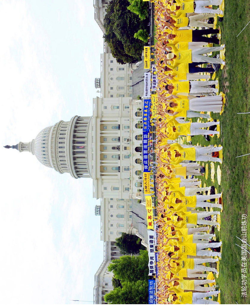
法轮功学员在美国国会山前炼功