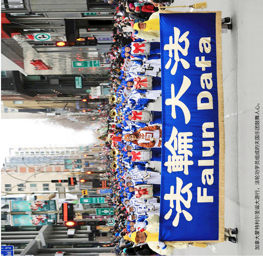
加拿大蒙特利尔圣诞大游行，法轮功学员组成的天国乐团鼓舞人心。