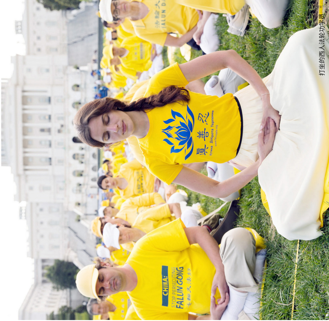
打坐的西人法轮功学员