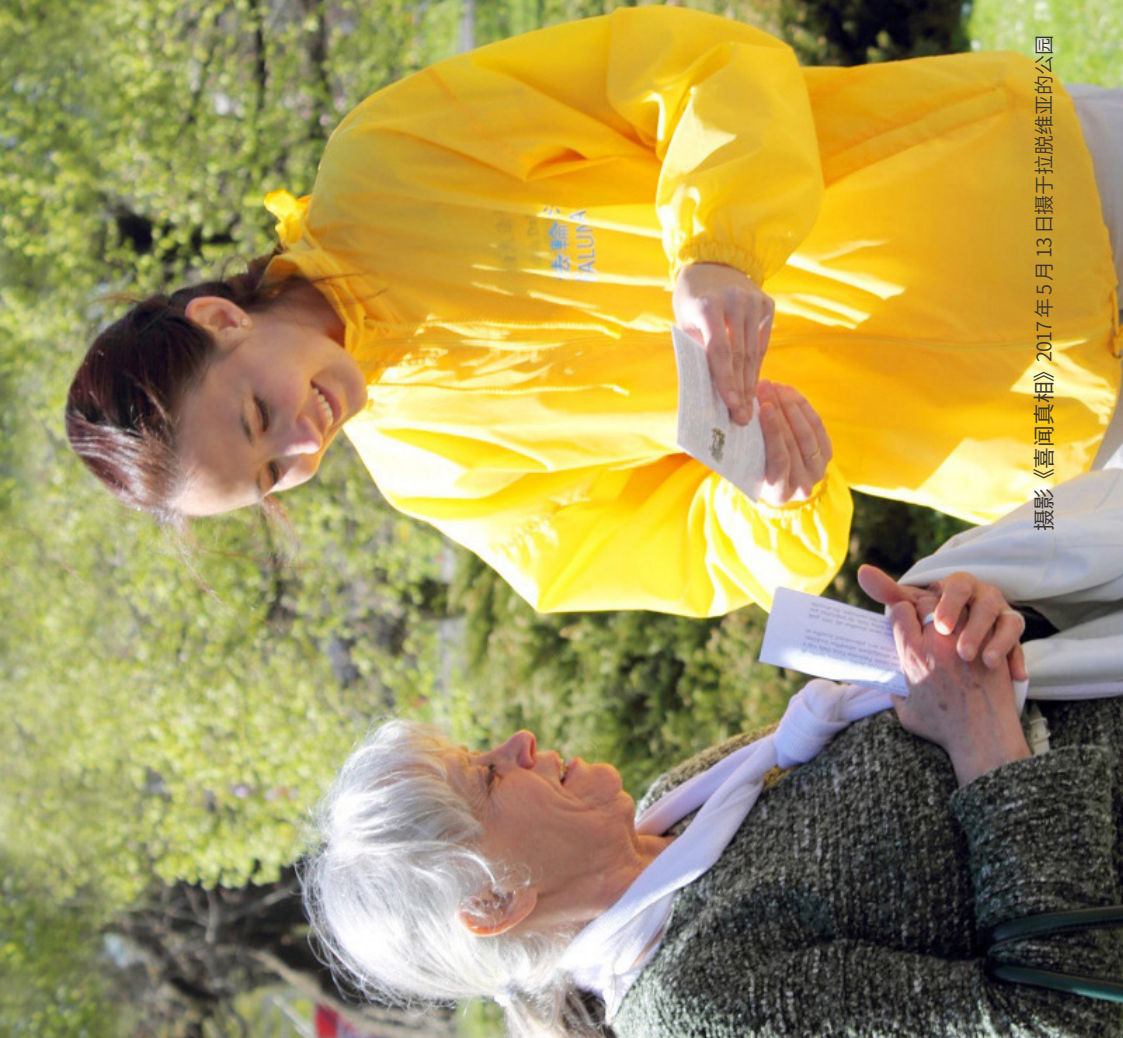
摄影《喜闻真相》2017年5月13日摄于拉脱维亚的公园