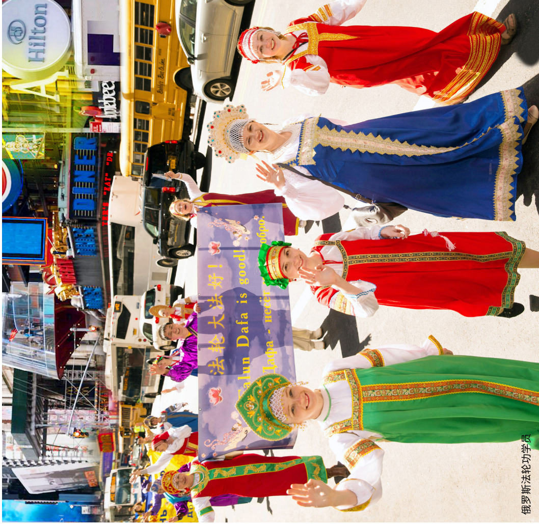
俄罗斯法轮功学员