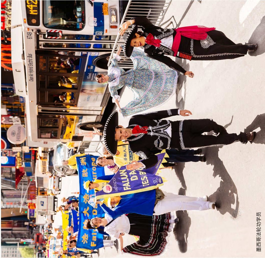
墨西哥法轮功学员