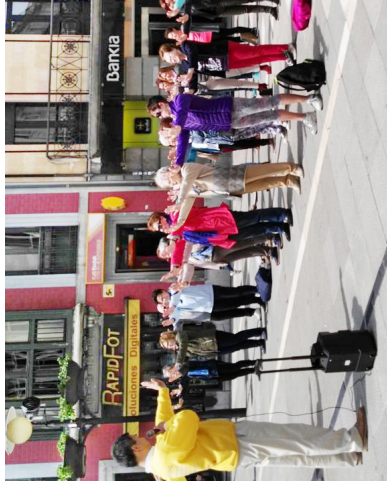
西班牙民众学炼法轮功。该国媒体 Nueva Alcarria 报道：全球只有中共不让炼法轮功。