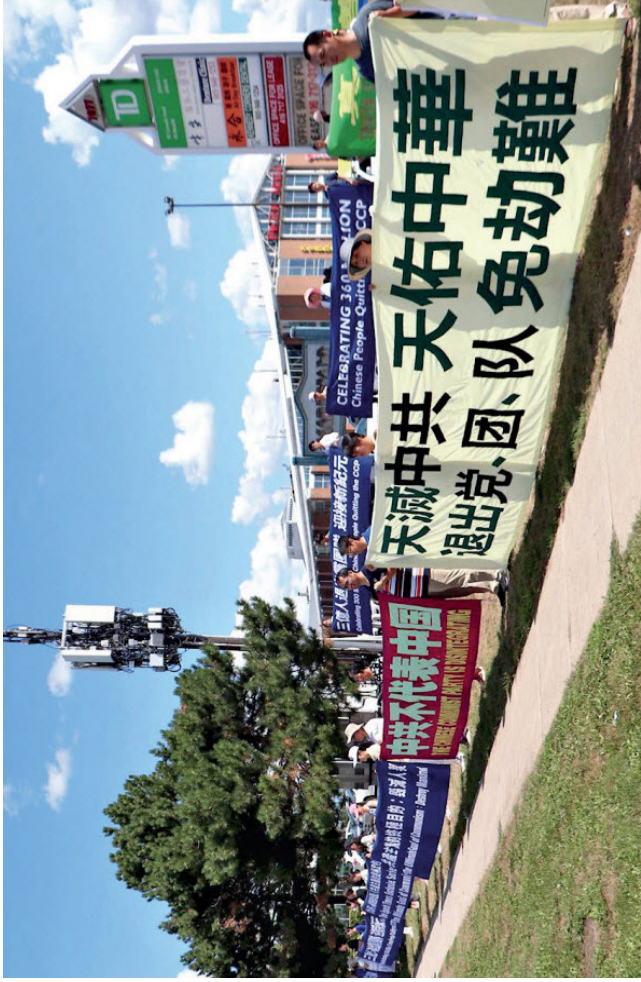
2020 年 8 月 8 日，加拿大“退党服务中心”在多伦多声援 3.6 亿中国人退出中共团队。