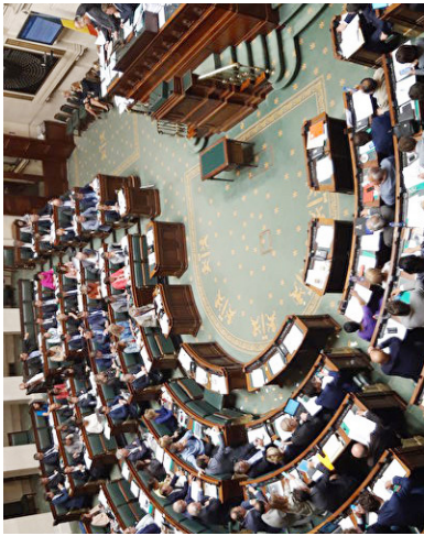
比利时联邦参议院 2020 年 6 月 12 日通过决议，谴责中共活摘人体器官牟利的暴行。

1999 年 7 月 20 日，中共党魁江泽民认为法轮功讲“真善忍”是对中共（依靠“假恶暴”控制民众）的威胁，因此发动了迫害，扬言 3 个月消灭法轮功。法轮功学员们坚定地走过了 21 年。中共红船却在自己掀起的恶浪中日渐倾覆。