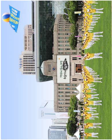
韩国法轮功学员 2019 年 7 月 20 日在首尔广场炼功，并向市民和游客讲述法轮功真相。

玄润灵的太太李喜进也是数学博士，她说：“我以前是完美主义者，非常傲慢，经常与人发生矛盾，伤别人的心，自己也活得很累。修炼法轮大法以后，我学会了遇事查找自己的问题，为别人着想，善待别人。法轮大法点亮了我的人生！”