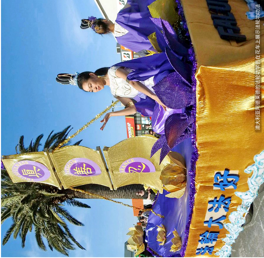
澳大利亚阿德莱德的法轮功学员在花车上展示法轮功功法