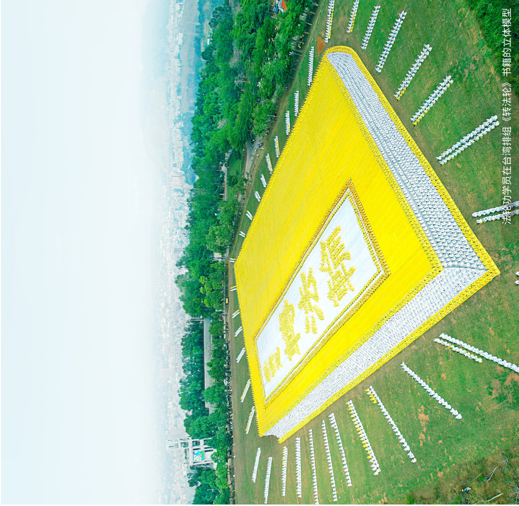
法轮功学员在台湾排组《转法轮》书籍的立体模型