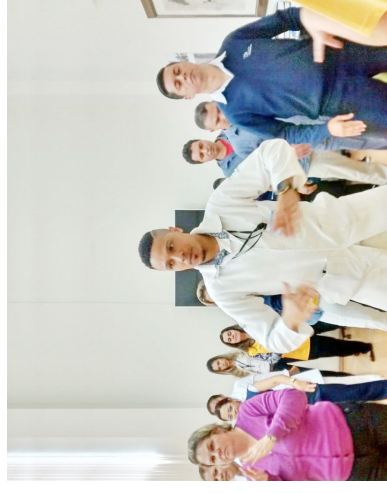
巴西圣保罗市大型医院 Presidente Epitácio 医院的医护人员学炼法轮功，他们表示炼功后身心轻松。