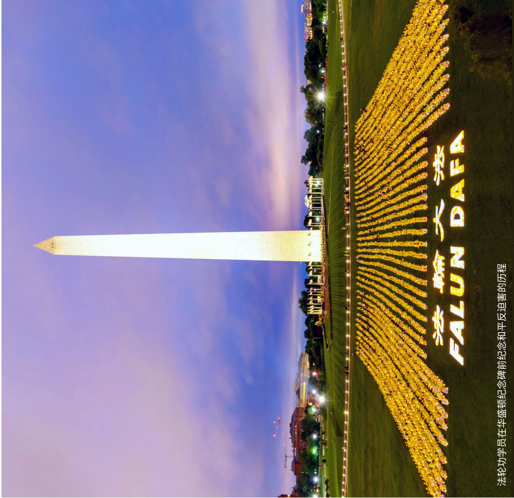
法轮功学员在华盛顿纪念碑前纪念和平反迫害的历程