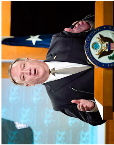
美国务院 2020 年 7 月 20 日发表声明：中共必须停止迫害法轮功，21 年的迫害已历时太久。