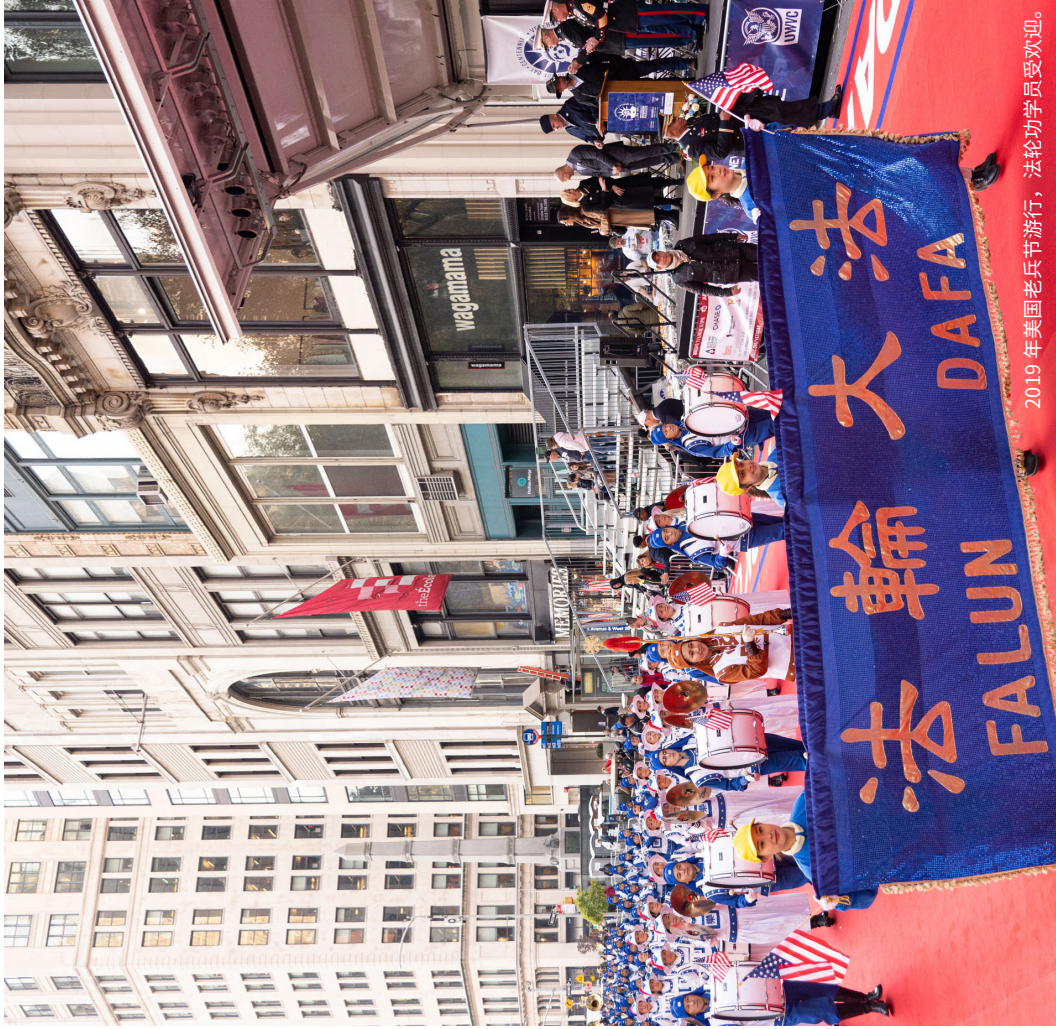
2019 年美国老兵节游行，法轮功学员受欢迎。