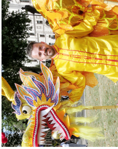
托玛克在欧洲法轮功学员的游行队伍中，参加舞龙。他说：“真善忍”帮我找到人生方向。