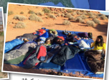
骑手们在沙漠里宿营