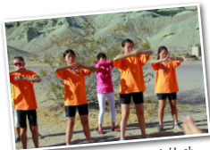
骑手们在沙漠中炼法轮功