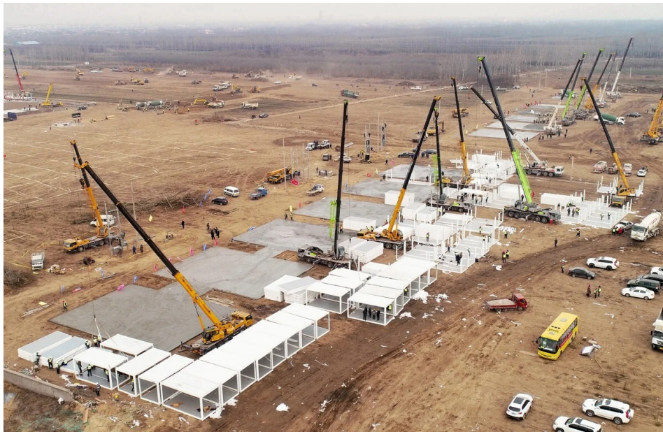
2021年1月15日，河北省石家庄市正在赶建的大型方舱医院。

第二波武汉肺炎疫情正在全球卷土重来，迅速蔓延。各国政府纷纷采取封锁、宵禁、关闭学校等措施应对。