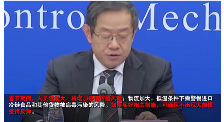
2021年1月13日，疾控中心副主任冯子健称：“相关的防控措施……可以确保不发生、不出现大规模的疫情反弹。”

1月13日，中共召开新闻发布会，介绍武肺疫情防控情况，实际是中共御用专家和官媒的新一轮公开撒谎。