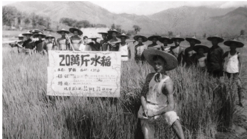
图4.2 大跃进时期中国农村充满着“亩产多少万斤”的造假景象。

华东师大历史学教授杨奎松指出，这源于中共体制的弊病。上面考查下面都用数字，谁数字报得高，谁就会得到上边的肯定。哪个省委书记都不愿自己的数字比别人低。