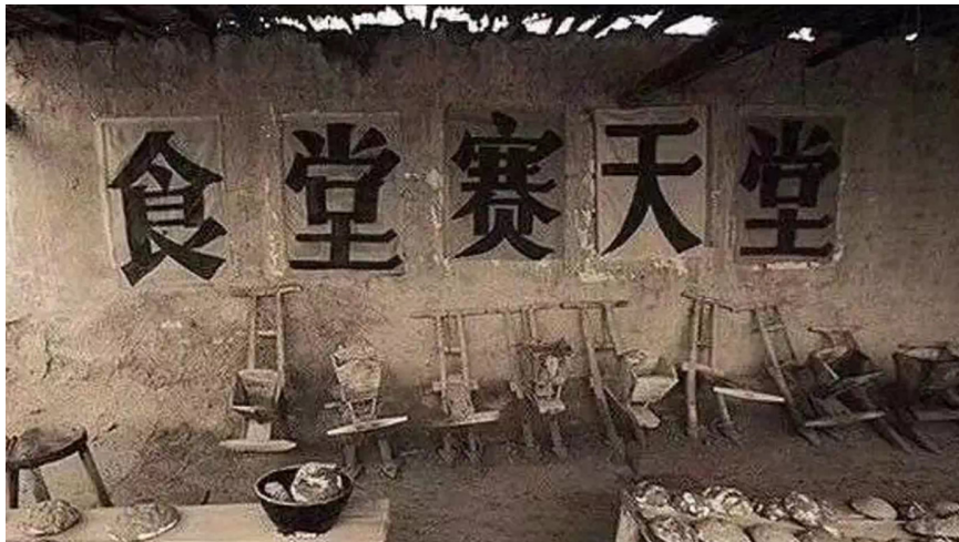
图4.3 人民公社时期的大食堂。