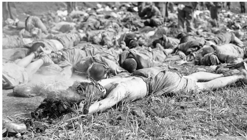
图3.5 中共的人海战术使得“志愿军”死伤无数。