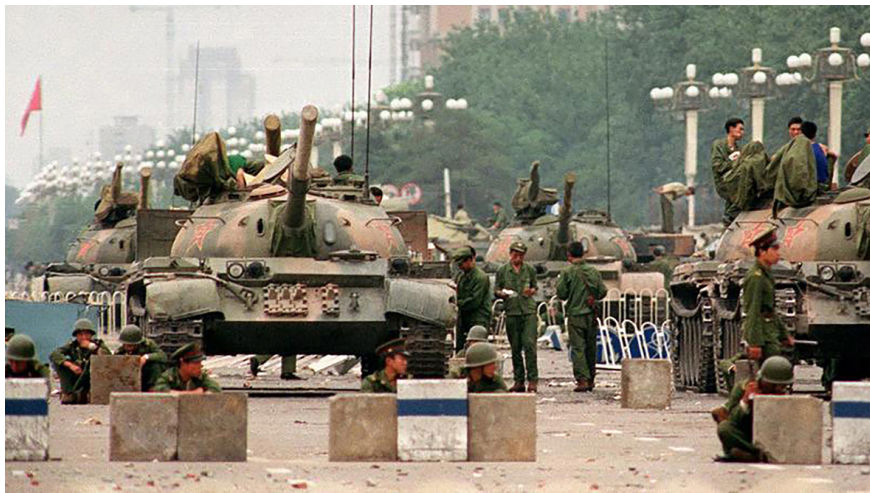
图5.1 1989年6月4日，北京天安门广场。

来到美国后第二天，我就和来接飞机的同学们争吵了起来。我跟他们打赌，天安门根本没死人；对“六·四”的造谣是西方反华势力所为；你们可别忘了自己是中国人等等。可是同学们给