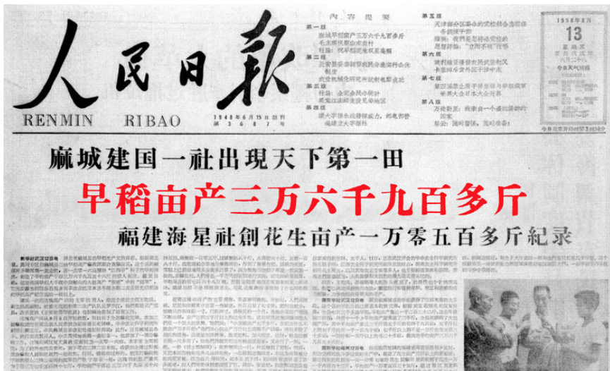
图4.1 大跃进时期《人民日报》的报道。

随后几个月内，人民日报放了几十颗“卫星”：河南省西平县小麦亩产7320斤；湖北省麻城县早稻亩产3.69万斤；广东中稻亩产6万斤；直至广西环江县中稻亩产13万斤。