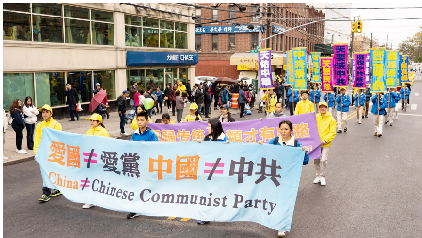
图6.4 2019年10月20日，法轮功学员在纽约布鲁克林游行，向人们讲述真相。

指的是一个朝代。可是，哪一朝去了，下一朝不来？在这块有着5000年历史的土地上，“中国”将永远存在下去。