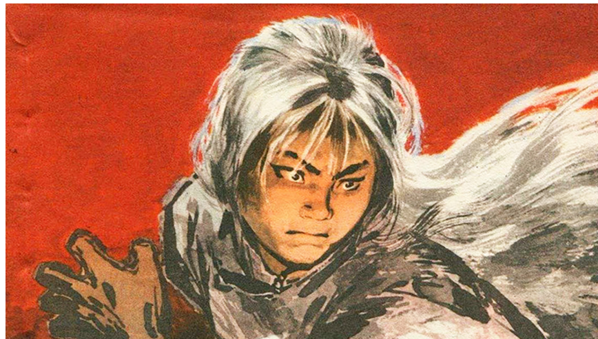
图2.4 《白毛女》连环画。中共借《白毛女》成功煽起了群众对“旧社会”的仇恨。

1945年，经历过延安整风运动后的延安鲁迅艺术学院的一些人，在院长周扬的指示下，根据这个传说创作出歌剧《白毛女》。