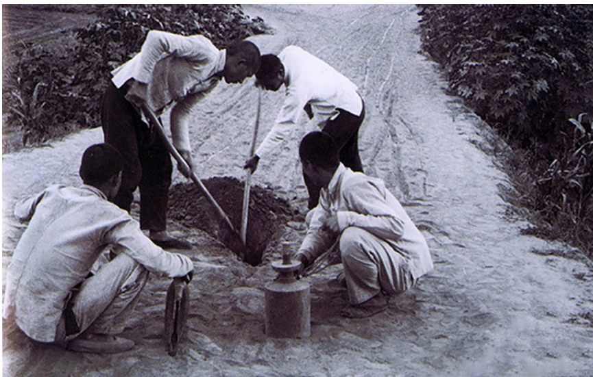
图1.2 八路军让埋的雷“净害老百姓”。