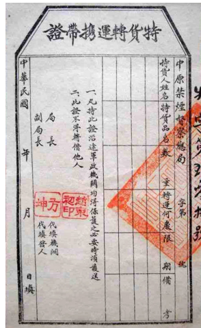
图3.1 吸食鸦片的人。图3.2 “解放区”中原禁烟督察总局特货（鸦片）转运携带证。