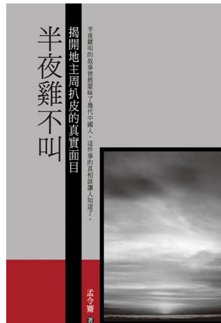
图2.1 1964年《半夜鸡叫》动画片海报。图2.2 孟令骞《半夜鸡不叫》。