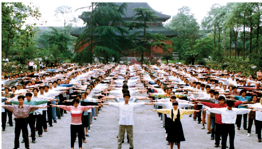
图 5.2 1999 年 7 月 20 日前，四川省成都市的部分法轮功学员在晨炼。

在这个普遍堕落的时代，人的内心深处仍有向善的精神渴求，我也一直在寻觅，寻觅那条让生命能升华的路。拜读法轮大法的著作，茅塞顿开，从最低层次中说，我知道了怎么做个好人，我再不会用笔去欺骗别人，我再不会明明白白干坏事，伤害别人，我有了衡量事物好坏的标准——“真、善、忍”，我内心从此拥有了平静与无私，也无忧无惧，生命充满了感恩和对他人的善。我要告诉所有的人：法轮大法好！