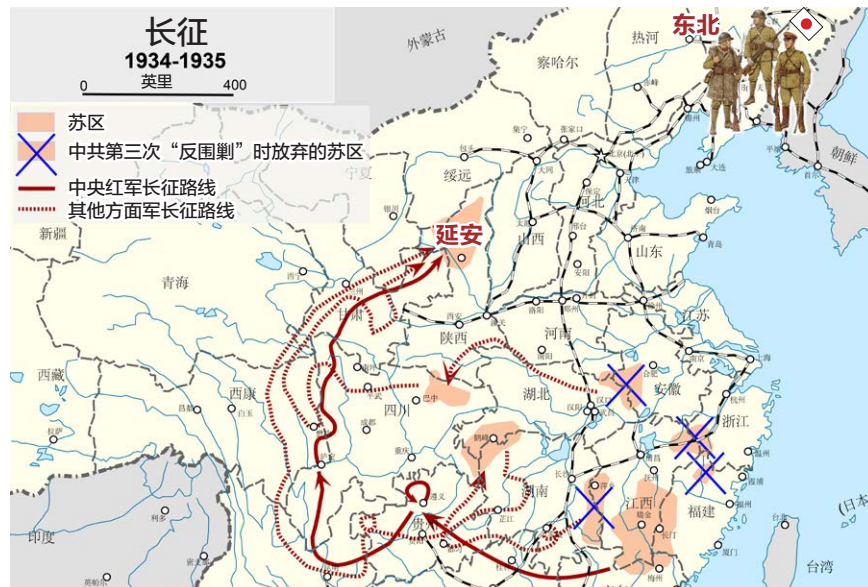
图1.1 从红军长征路线和东北日军所在位置可以看出“北上抗日”只不过是逃跑的幌子。

1935年6月，中央红军在懋功两河口与张国焘队伍会师，才决定“北上”方针，计划建立川陕甘根据地，但张国焘不同意。1935年9月18日，毛泽东偶然从旧的《大公报》上得知陕北依