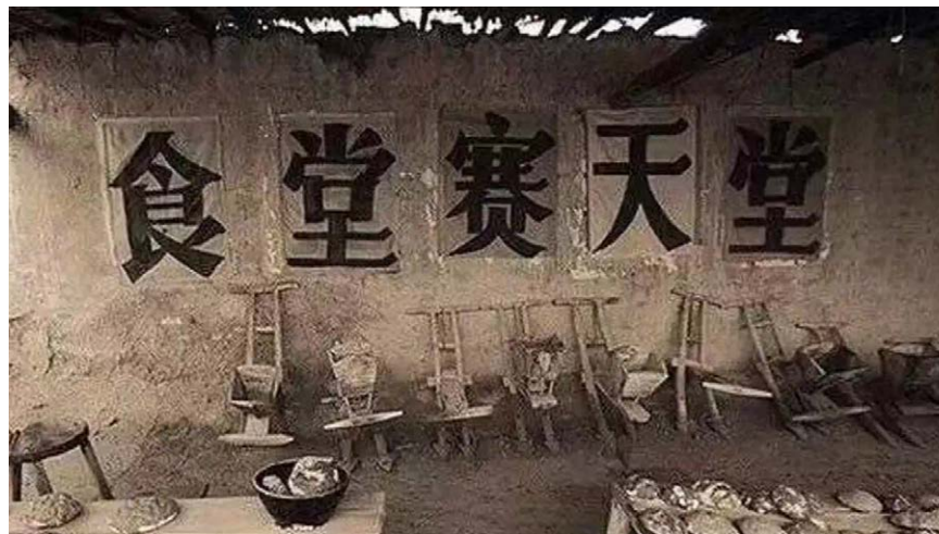
图4.3 人民公社时期的大食堂。