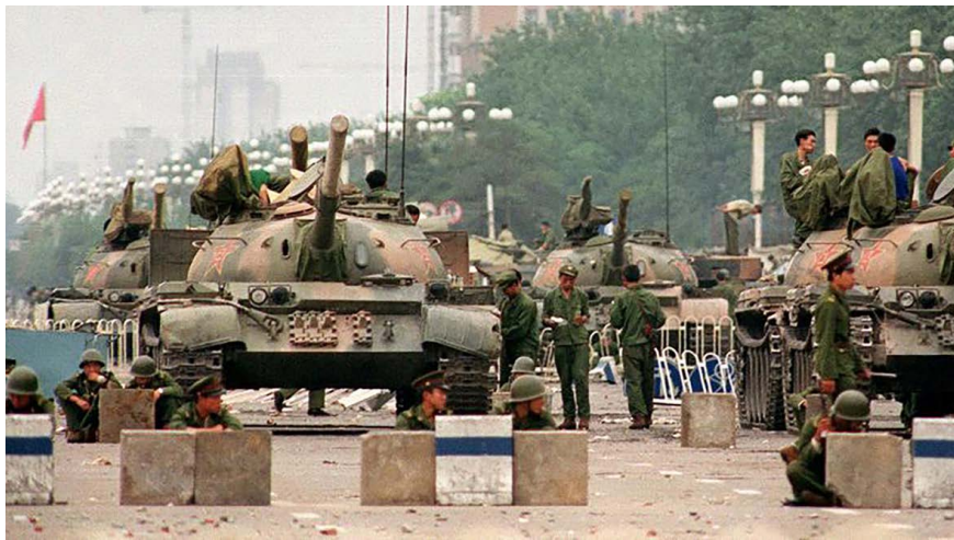
图 5.1 1989 年 6 月 4 日，北京天安门广场。

来到美国后第二天，我就和来接飞机的同学们争吵了起来。我跟他们打赌，天安门根本没死人；对“六·四”的造谣是西方反华势力所为；你们可别忘了自己是中国人等等。可是同学们给