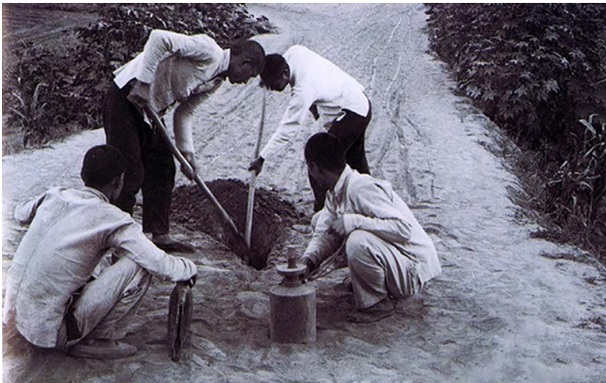
图 1.2 八路军让埋的雷“净害老百姓”。