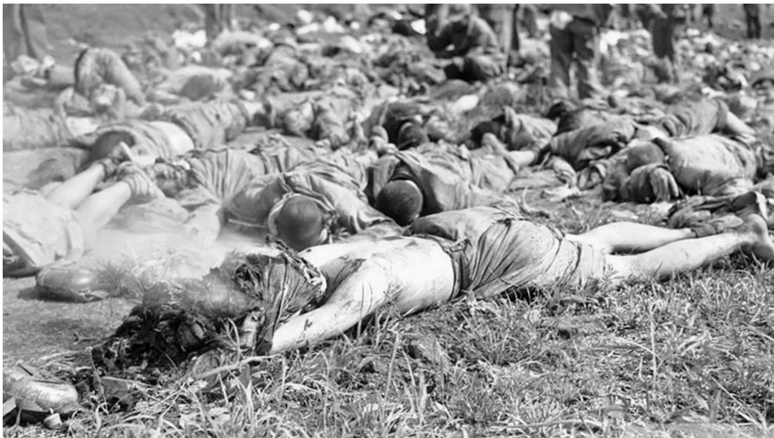
图3.5 中共的人海战术使得“志愿军”死伤无数。