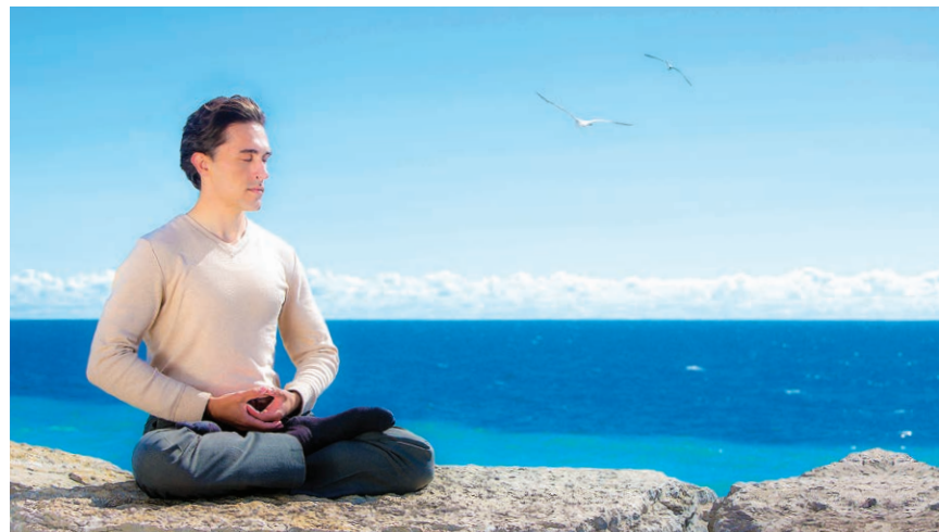
图 6.6 法轮大法已弘传世界100多个国家和地区，深得世界各族民众的喜爱和尊敬。