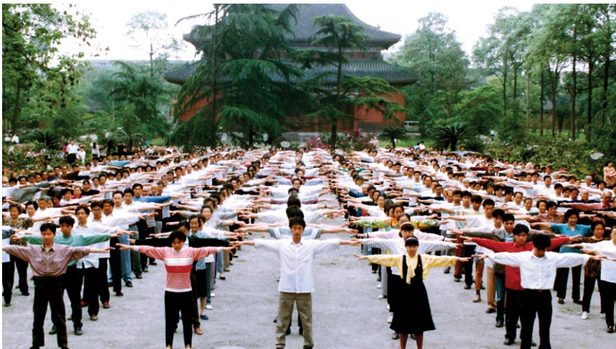
图 5.2 1999 年 7 月 20 日前，四川省成都市的部分法轮功学员在晨炼。

在这个普遍堕落的时代，人的内心深处仍有向善的精神渴求，我也一直在寻觅，寻觅那条让生命能升华的路。拜读法轮大法的著作，茅塞顿开，从最低层次中说，我知道了怎么做个好人，我再不会用笔去欺骗别人，我再不会明明白白干坏事，伤害别人，我有了衡量事物好坏的标准——“真、善、忍”，我内心从此拥有了平静与无私，也无忧无惧，生命充满了感恩和对他人的善。我要告诉所有的人：法轮大法好！