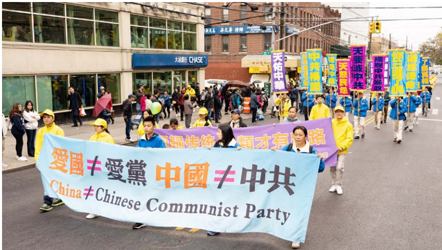
图6.4 2019年10月20日，法轮功学员在纽约布鲁克林游行，向人们讲述真相。

指的是一个朝代。可是，哪一朝去了，下一朝不来？在这块有着5000年历史的土地上，“中国”将永远存在下去。