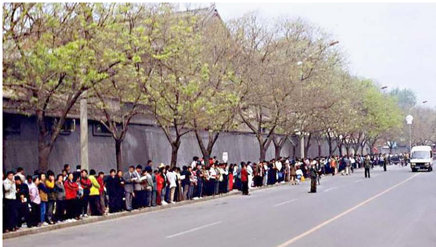
图 6.1 1999 年 4 月 25 日，北京，“4·25”现场。

1999 年 4 月 11 日，中科院院士何祚庥在天津教育学院《青少年科技博览》杂志发表文章，污蔑法轮功致人得精神病。天津法轮功学员去编辑部澄清真相，却遭到天津市公安局防暴警察的殴打，45 人被抓。4 月 25 日，万名法轮功学员到北京中南海附近