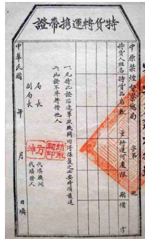
图3.1 吸食鸦片的人。图3.2 “解放区”中原禁烟督察总局特货（鸦片）转运携带证。