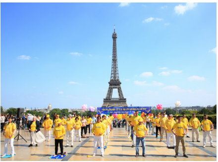
法国法轮功学员在巴黎埃菲尔铁塔下集体炼功

世界各国各级政府机构、团体组织等，纷纷颁奖并高度推崇法轮功在提升道德、净化人心、强身健体与福国利民方面的卓越成果。