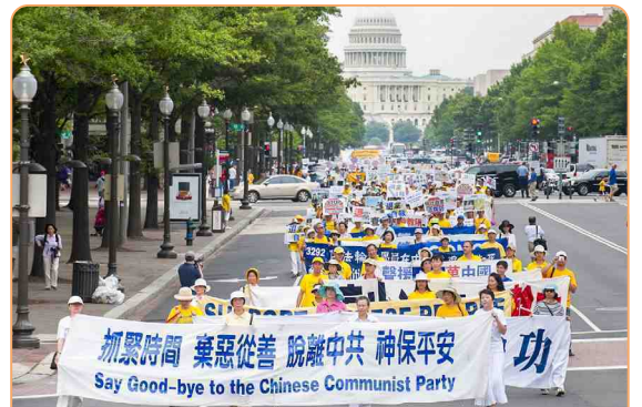
◎ 法轮功学员游行队伍浩浩荡荡穿越美国华盛顿中心大道，告诉大陆同胞赶快退出中共。

几天后，乡书记看了《九评共产党》，也有了那种恍然觉悟的感觉。他找到炼法轮功的同学了解真相，同学给他讲了三个小时。这次他是明白了，用一个很吉祥的化名做了“三退”。