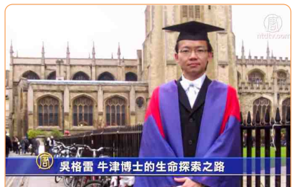
◎ 格雷说：修心炼功，我多年的胃病痊愈了；精神状况也变得非常好，有充沛的精力做研究。