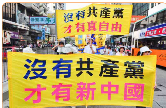
◎ 越来越多的善良、正义之士都看清了一个真理：“中共不等于中国”“爱国不等于爱党”。