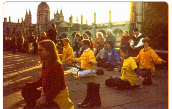
◎ 剑桥大学国王学院楼前广场上，法轮功学员晨炼的身影，给这所著名学府带来了勃勃生机。

全世界几乎所有的国家都赞成修炼法轮功，为什么只有中国大陆不允许？如果真像中共所抹黑宣传的那样，那为什么没有第二个国家禁止学炼呢？人啊，应该用自己的头脑去辨析。