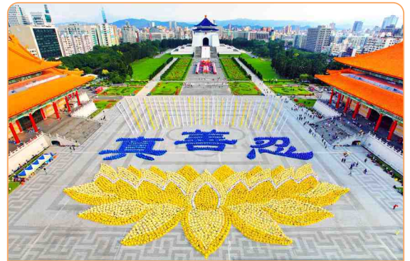
◎ 5000 多名法轮功学员齐聚台湾台北自由广场，排出了优美的莲花座和“真善忍”三个大字。

华裔科学家黄祖威博士，是美国国家航空航天局的高级工程师，他感慨地说：“《转法轮》这书太好了，把很多目前科学还无法解释的东西，比如‘善恶有报’等等，非常清晰地、系统地讲了出来。我觉得这本书讲得非常具有科学性。”