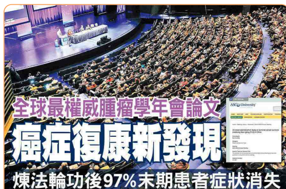
◎ 美国临床肿瘤学会年会上，癌症末期患者修炼法轮功后痊愈的研究成果令国际医学界关注。