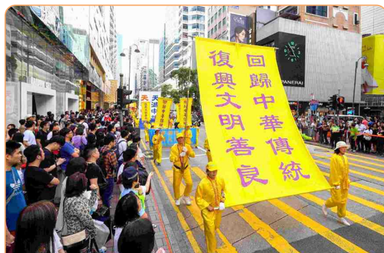
◎ 香港法轮功学员壮观的游行队伍，吸引了众多大陆游客驻足观看，人们纷纷拍照留念。

但是，只把五星血旗烧掉了还不行，还不算彻底，怎么办？做“三退”，从心里到行动都远离中共，抛弃它，不要它，它就不会祸害到你，你就幸福平安了！戴红领巾的孩子，从心里退出少先队，那个红领巾上面的血腥之气就不起作用了。