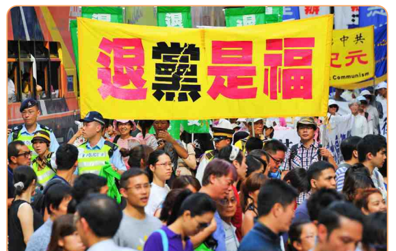
◎《九评》揭露了中共“假恶暴”的本质，引发“三退”大潮。“退党是福”成为大陆流行语。