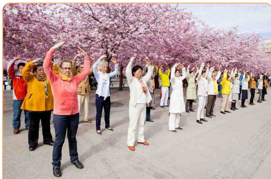
◎ 瑞典法轮功学员在皇家花园美丽的樱花树下集体炼功，祥和的场面成为一道靓丽的风景。