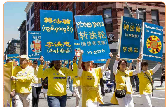
◎ 万人大游行队伍横穿曼哈顿，各族裔法轮功修炼者高举不同语种的《转法轮》著作模型。