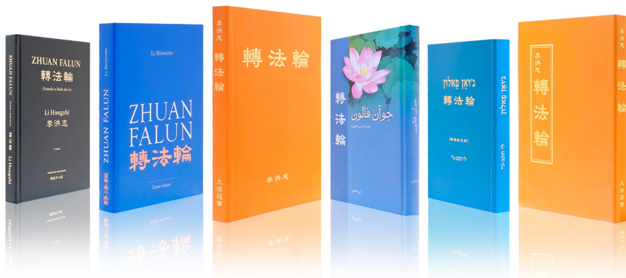
《转法轮》被翻译成50种语言在世界各地出版发行

他说：“这次全家死里逃生之后，我对法轮大法有了全新的认识，这一次我是真真切切感受到了法轮大法救了我们全家，这使我对大法坚信不疑，直到现在也在坚持每天炼功和阅读《转法轮》。也希望更多的人能知道‘法轮大法好，真善忍好’，危难时刻能得到大法的救度。”