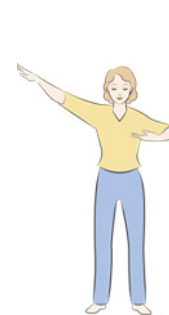
第一套功法 佛展千手法