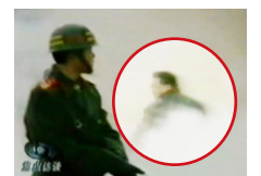
穿大衣男子站在出手打击方位。