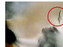
刘被击打头部后，一条状物弹起。