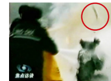
刘触摸被击打部位，随之倒地。