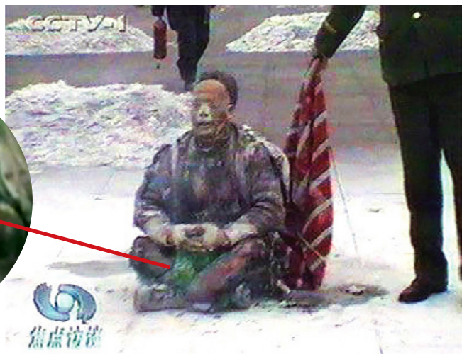
警察晃着灭火毯等镜头

瓶子开始变软，7秒钟收缩变形，10秒钟缩成一个小疙瘩并燃烧。难道王进东两腿间的塑料瓶是特殊材料做的？