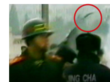
条状物翻转下落，多角度展现。