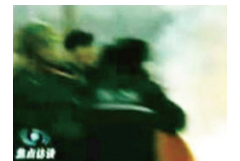
条状物飞出画面，摄像机左移。