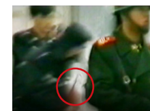
摄像机左移，见条状物。