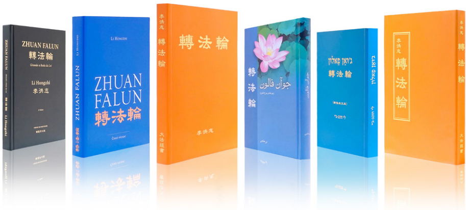
《转法轮》被翻译成50种语言在世界各地出版发行

他说：“这次全家死里逃生之后，我对法轮大法有了全新的认识，这一次我是真真切切感受到了法轮大法救了我们全家，这使我对大法坚信不疑，直到现在也在坚持每天炼功和阅读《转法轮》。也希望更多的人能知道‘法轮大法好，真善忍好’，危难时刻能得到大法的救度。”