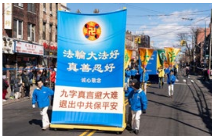
2020年3月2日，法轮功学员在美国纽约大游行，传递救世良方。

他说：“这次全家死里逃生之后，我对大法有了全新的认识，这一次我是真真切切感受到了法轮大法救了我们全家，这使我对大法坚信不疑，直到现在也在坚持每天炼功和阅读《转法轮》。也希望更多的人能知道‘九字真言’，危难时刻能得到大法的救度。”