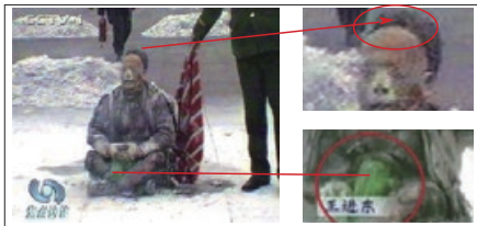
警察晃着灭火毯等镜头