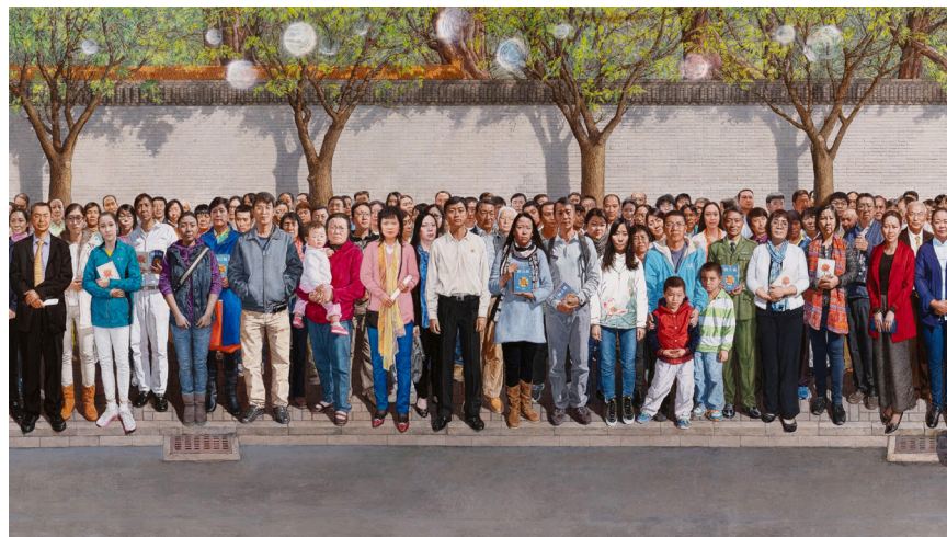
图3.1 油画：《一九九九年四月二十五日》局部，作者：孔海燕。

“国际教育发展组织”（IED）于2001年8月14日在联合国会议上，就“天安门自焚事件”强烈谴责中共当局的“国家恐怖主义行径”：所谓“天安门自焚事件”是对法轮功的构陷，涉及惊人