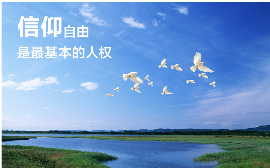
图 3.2 信仰自由是公民最基本的人权