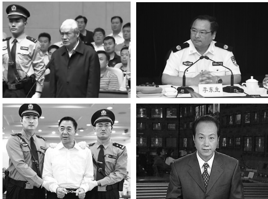
图5.1 左上：周永康；右上：李东生；左下：薄熙来；右下：罗京。

在国务院工作人员和法轮功代表会谈之际，上万名法轮功学员一直在外静静地等候。到晚上8点多会谈完毕，得知天津方面已经释放被抓的法轮功学员，上访的法轮功学员也平静地散去。临行时，地上清理得干干净净，一片碎纸都没有留下，连警察扔下