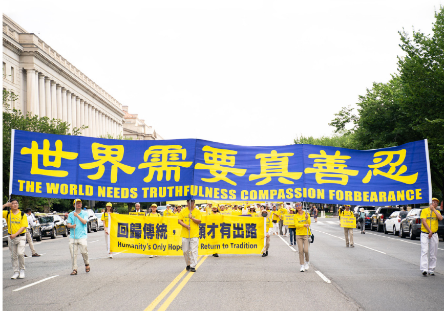
图3.5 世界需要真善忍

面对今天中国社会的道德乱象，回首1999年的“四·二五”和平大上访，法轮功学员维护信仰“真、善、忍”的自由，争取做道德高尚的好人的权利，就愈加显示出其辉煌的历史意义。