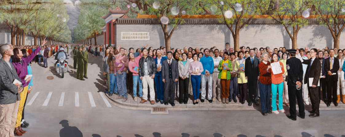
一九九九年四月二十五日 油画 孔海燕 2019