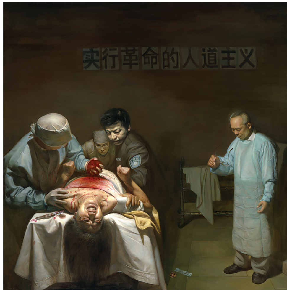
活摘器官 油画 董锡强 2007

◆ 1999年7月20日，江泽民与时任政法委书记罗干勾结，悍然发动了对法轮功的迫害，并延续至今。