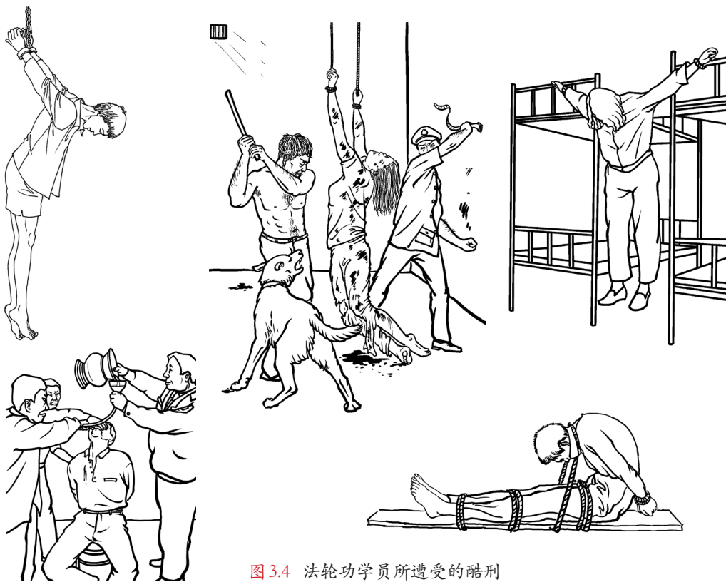
图 3.4 法轮功学员所遭受的酷刑

中共迫害法轮功，不仅违反了《宪法》中的规定——公民有信仰自由、言论自由、集会结社自由等等权利，而且还犯下了《刑法》中的故意杀人罪、侮辱罪、诽谤罪、绑架罪、敲诈勒索罪等多种罪行。