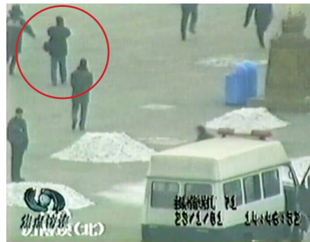
图4.3 背着摄影包的男子

在“自焚”录像上能看到有一个背着摄影包的男子在天安门广场的军警中间自由地拍摄。（右图）