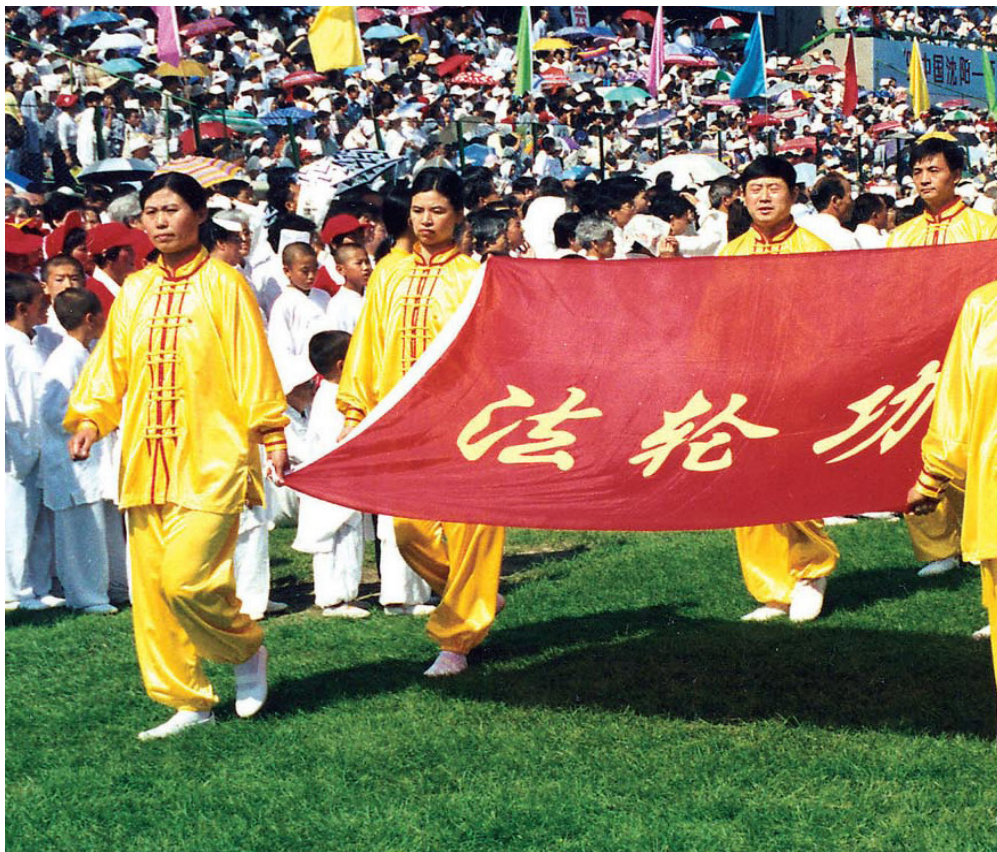
图1.2 1998年8月20日,法轮功队伍在“中国沈阳-亚洲体育节”的开幕式上入场。