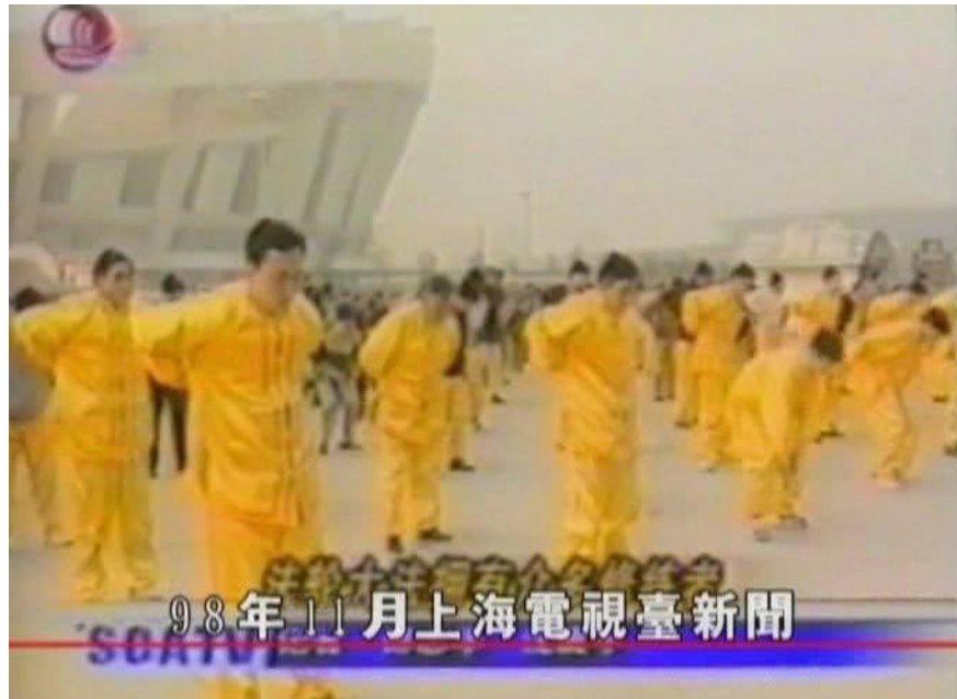
图 1.1 1998年11月24日，上海电视台报道法轮功。（视频截图）

如今，法轮功已经弘传世界100多个国家和地区，深受不同族裔人们的爱戴，上亿修炼者身心受益。国际社会、各国政要鉴于李洪志先生和法轮功对人类身心健康作出的杰出贡献，纷纷颁发褒奖，赞扬“真、善、忍”是普世价值，为世界带来福祉。各国、各地政府和团体组织纷纷宣布“法轮大法月”“法轮大法周”和“法轮大法日”来支持法轮大法。截至2023年5月，来自各国政府的褒奖、支持议案和信函达5800多项。