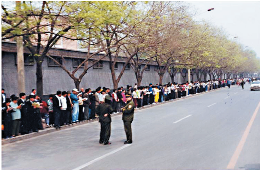
图1.4 历史图片：1999年4月25日，“四·二五”上访现场。