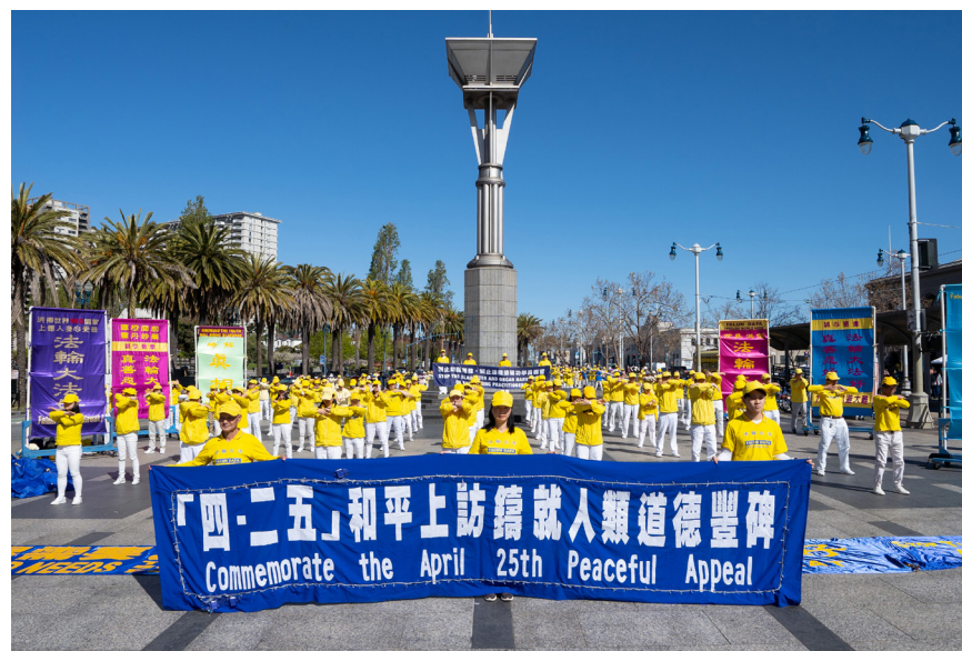
图 3.3 2023 年 4 月 22 日，法轮功学员在美国旧金山纪念“四·二五”上访 24 周年。

谨以此文，献给25年前的那个“四·二五”，纪念那座“真、善、忍”铸就的道德丰碑。