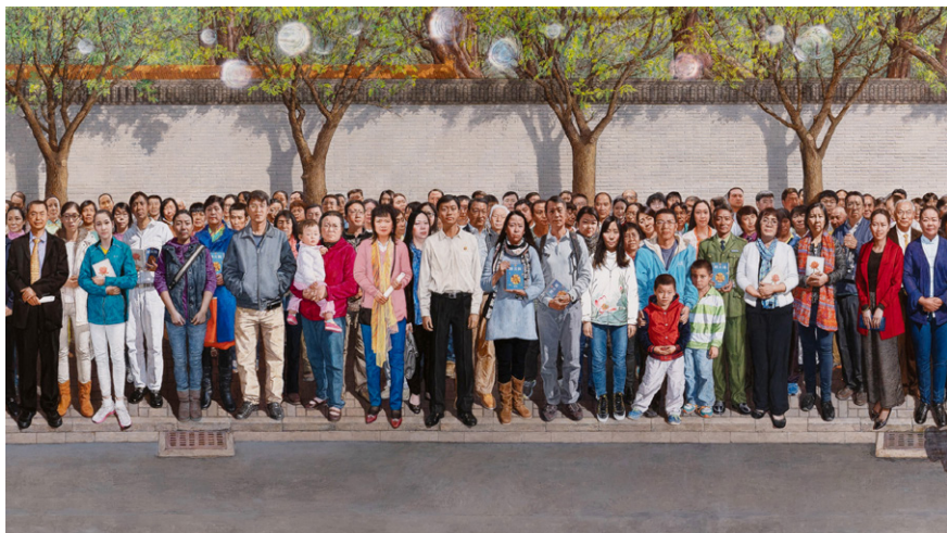
图 3.1 油画：《一九九九年四月二十五日》局部，作者：孔海燕。

的方方面面都已暴露得淋漓尽致，每个人都能随口举出一堆实例，再粉红也难以否认。对内，中国人内卷没底线，用极端自私、伤天害理、杀人害命都不足形容，而且是举国上下笑贫不笑娼、黑白颠倒、善恶倒悬。在海外，粉红们通过翻墙、旅游、留学、移民，在全世界反反复复地把中国人的家丑翻晒出来，他们不是生怕世界上不知道中国人的丑陋，而是被中共教得无知、无耻和自私。