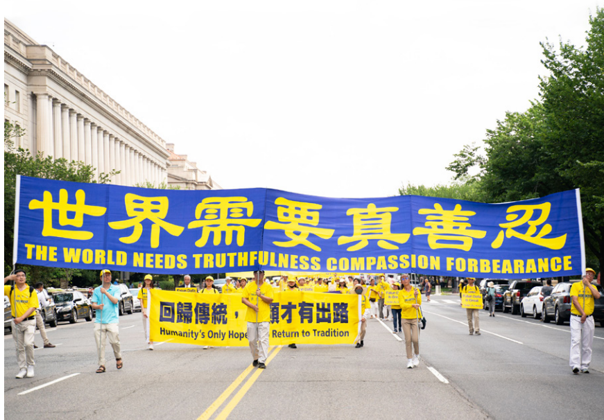
图3.5 世界需要真善忍

面对今天中国社会的道德乱象，回首1999年的“四·二五”和平大上访，法轮功学员维护信仰“真、善、忍”的自由，争取做道德高尚的好人的权利，就愈加显示出其辉煌的历史意义。