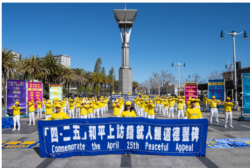
图 3.3 2023 年 4 月 22 日，法轮功学员在美国旧金山纪念“四·二五”上访 24 周年。

谨以此文，献给25年前的那个“四·二五”，纪念那座“真、善、忍”铸就的道德丰碑。