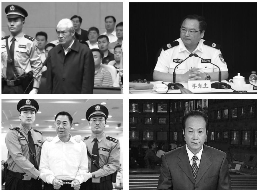
图 5.1 左上：周永康；右上：李东生；左下：薄熙来；右下：罗京。