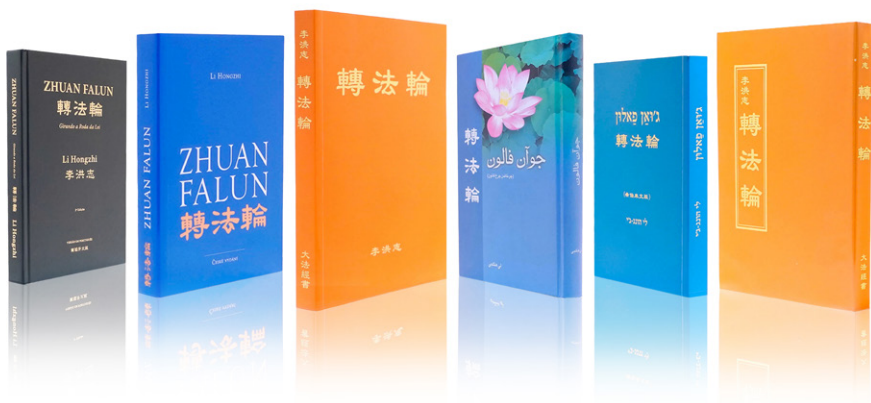
图6.1 各种语言版本的《转法轮》，可在法轮大法网站 falundafa.org 免费下载。