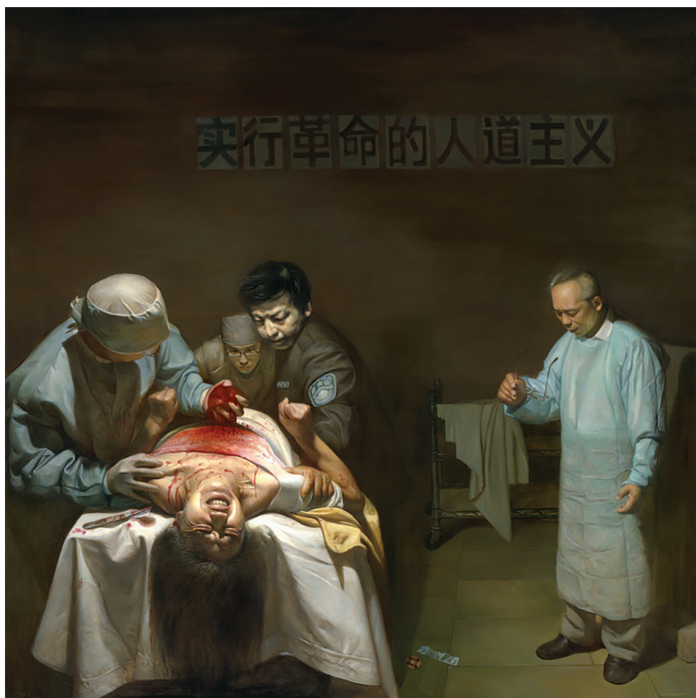
活摘器官 油画 董锡强 2007

这幅画表现的是法轮功学员被活摘器官的残忍场景。法轮功学员痛苦的表情、暴涨的青筋、握紧的双拳，似乎在发出无声而又撕心裂肺的呐喊，和警察的冷酷、医生的专业神态形成鲜明的对比。具有讽刺意义的是墙上挂着的横幅——“实行革命的人道主义”，揭示了中共好话说尽、坏事做绝的邪恶本质。画家意图通过这幅画来唤起人们的良知。