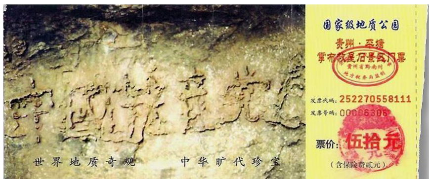
图 5.2 贵州平塘“藏字石”景区门票

活摘法轮功学员器官，又添累累血债。中共崇尚斗争哲学、功利主义，用暴力和金钱维持政权。一方面与天、地、人斗，竭泽而渔；一方面贪官污吏层出不穷，穷奢极欲，导致自然灾害、社会乱象频出。底层民众的生活、尊严、生命得不到应有的保障，百姓如同草芥；疫情、火灾、洪灾、地震，极端天气频现，天灾人祸不断，天怒人怨。这样罪恶累累的中共，上天还能容它吗？