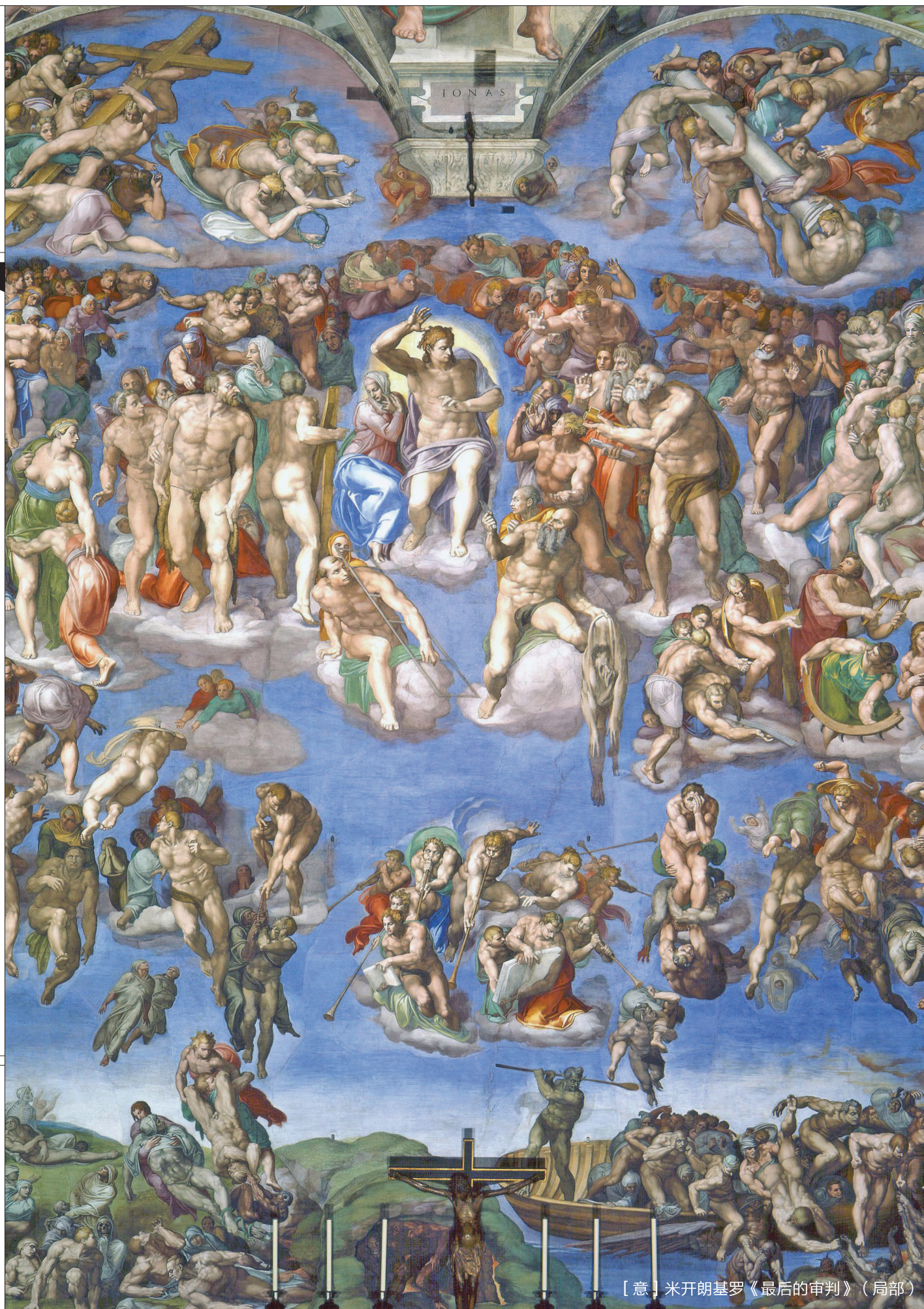
〔意〕米开朗基罗《最后的审判》（局部）