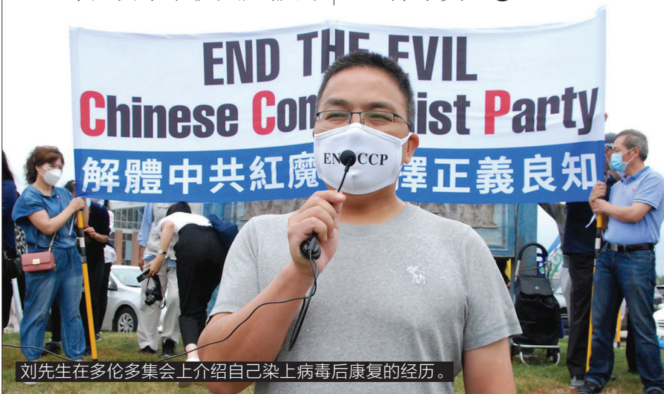
刘先生在多伦多集会上介绍自己染上病毒后康复的经历。

古人云：君子不立危墙之下。不与邪恶的中共为伍，就不会作为中共的一分子被淘汰。自救，拖延不得。如今已有三亿八千三百万人发表声明，退出了中共的党、团、队组织。希望您也能“三退”保平安。❶