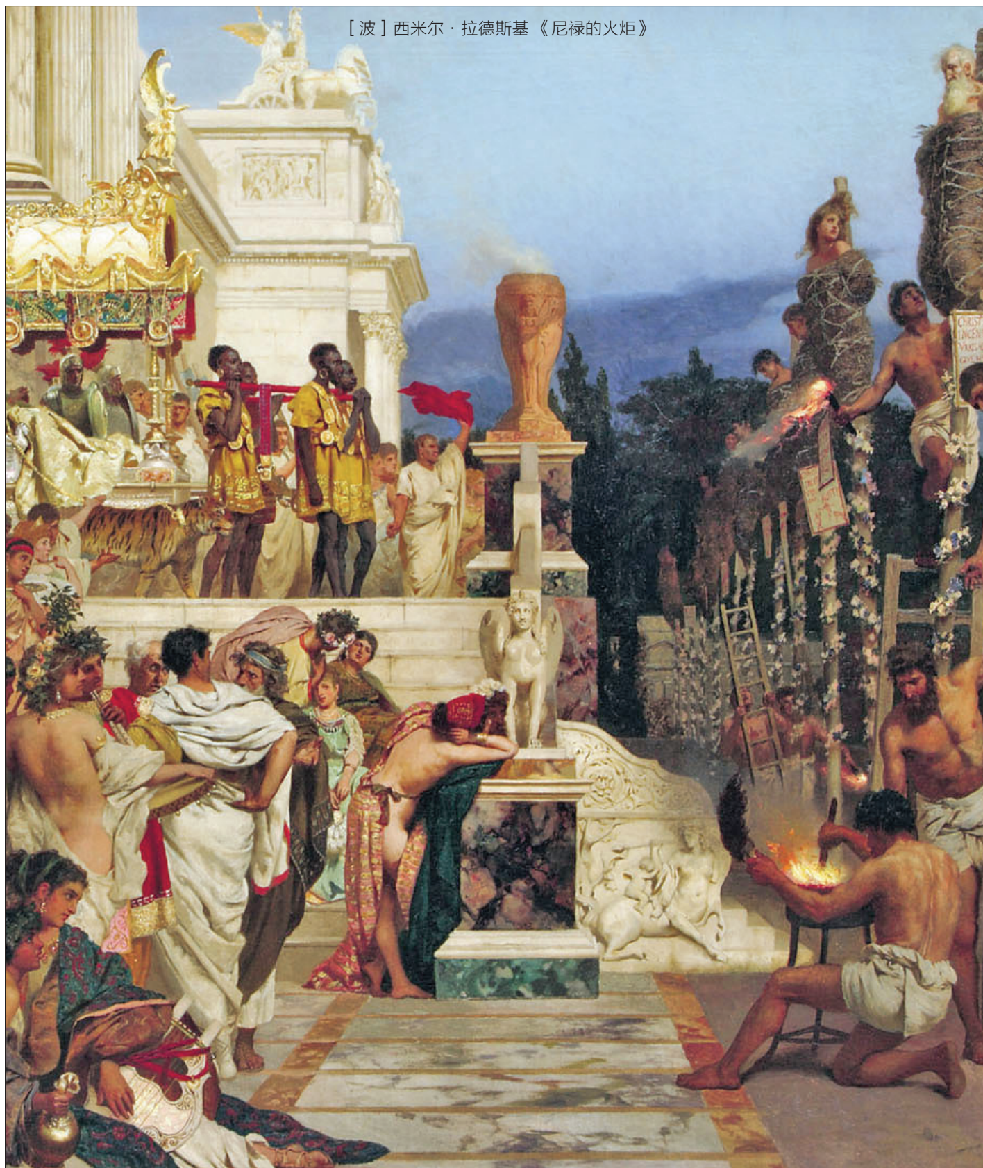
[波] 西米尔·拉德斯基 《尼禄的火炬》

为是疟疾的瘟疫只是序幕，那么，第一场真正的大瘟疫发生在公元125年，上百万人因它死去。第二场更大的瘟疫，则于公元166年降临，