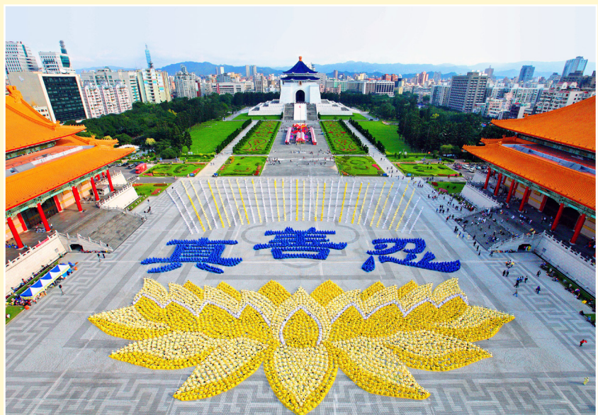
◎ 5000多名法轮功学员齐聚台湾台北自由广场，排出了优美的莲花座和“真善忍”三个大字。