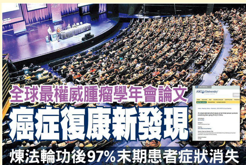
◎ 美国临床肿瘤学会年会上，癌症末期患者修炼法轮功后痊愈的研究成果令国际医学界关注。