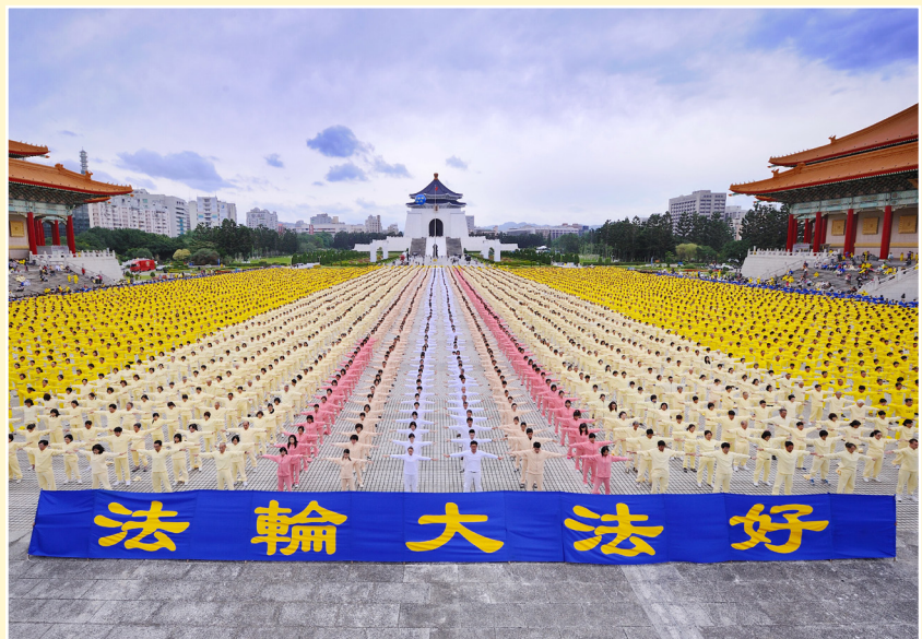
◎ 7000法轮功学员在台北自由广场炼功。台湾有50多万人修炼，受到政府的赞誉与支持。