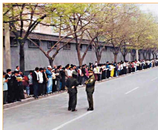
“4·25”上访现场。法轮功学员安静有序，警察在悠闲地聊天。