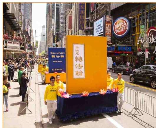
八千多名法轮功学员在美国纽约举行盛大游行，图为中英文《转法轮》书巨大模型。