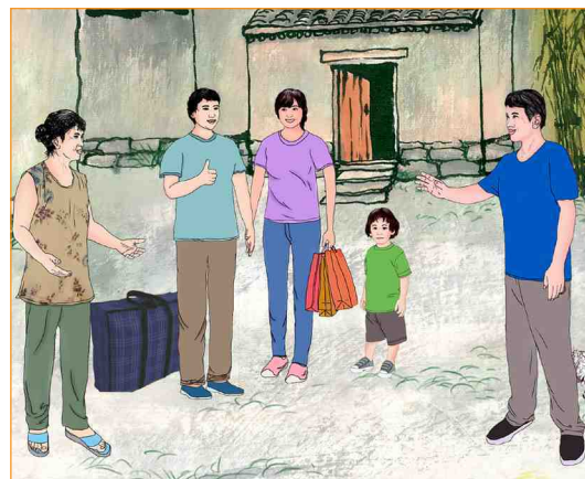
阿永把鸭子赶回去时，老婆婆一家人对阿永夫妇的大度和宽容很感激。

阿永把鸭子赶回去时，老人的儿子和儿媳妇也回来了，一家人对阿永夫妇的大度和宽容很感激，要赔钱。阿永说：“不用了，你们上有老下有小，拖儿带女很不容易啊！以后关好就行了。”老人说：“我们家今天遇到好心人啦！”这事在村里传为佳话。