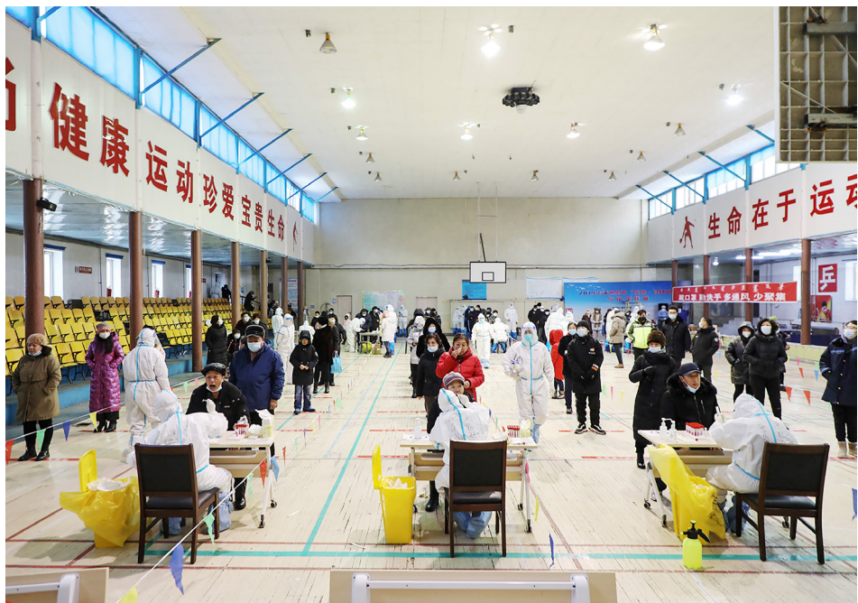
2021 年 11 月 28 日，中国内蒙古满洲里市，居民正排队进行 COVID-19 检测。