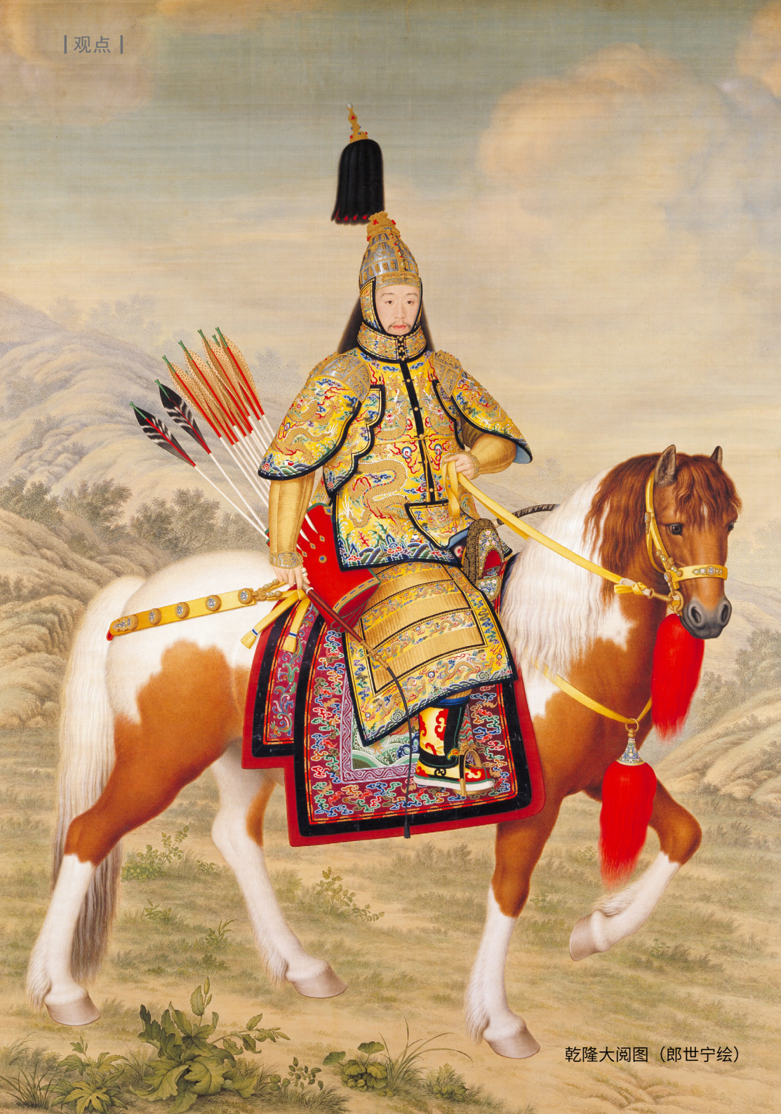
乾隆大阅图（郎世宁绘）

私枉法罪；民事、行政枉法裁判罪；执行判决裁定失职罪；执行判决裁定滥用职权罪；枉法仲裁罪；刑讯逼供罪；暴力取证罪；虐待被监管人罪。