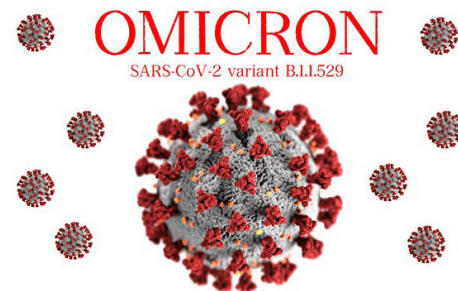
新变种病毒 Omicron 的传播范围更广。

中共当局 11 月 5 日承认，黑河市新发疫情形势严峻复杂。基因测序显示，多条传播链同时