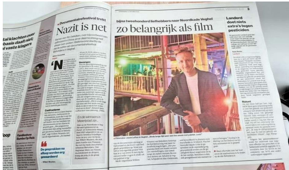
2021年10月14日，荷兰报纸报导纪录片电影节和《别问问题》。