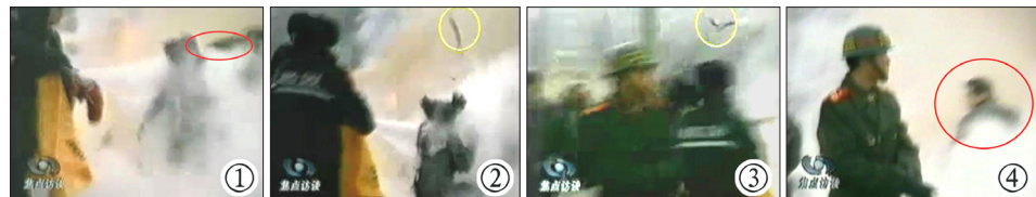
中共官方播出的“天安门自焚”画面中，可见“自焚者”遭黑棍击打倒地。

20 年后的今天，中共还在造谣诬陷法轮功，相信绝大多数人有智慧分辨是非，选择良善一方。◇