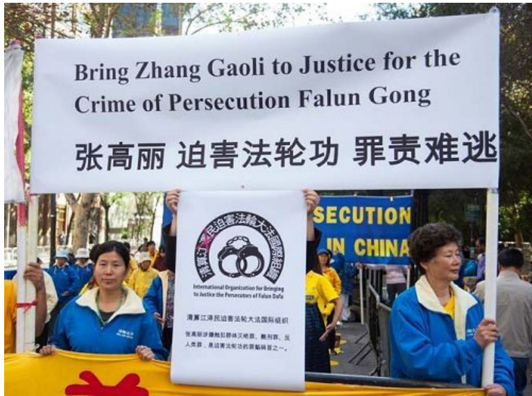
2014年9月23日联合国气候峰会在纽约联合国总部开幕,时任中央常委、国务院副总理的张高丽与会,法轮功学员到场抗议。

张高丽任职中央常委,仍未放松对天津法轮功学员的打压。2015年5月底,天津市数千名法轮功学员依法向最高检、最高法邮寄了实名控告江泽民的诉状,要求依法惩办迫害元凶江泽民。张高丽伙同天津市公安局长赵飞,操纵天津“610”(中共迫害法轮功的非法机构)、公安国保及下属的100多个派出所,大面积抓捕、拘留甚至审判诉江的法轮功学员及家属。