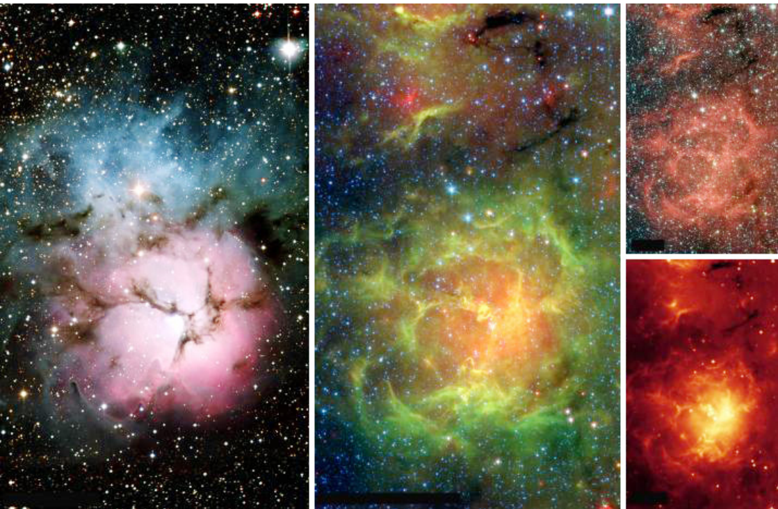
从红外光成像中观测到的天体