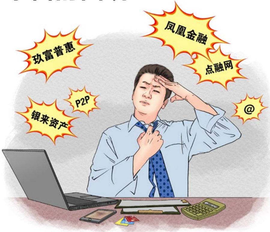
《平台暴雷》 绘画：善玉

初中和高中整天都是在为升学而忙碌，大学时才有了闲暇时间，我开始阅读老子和庄子的书。《庄子》文笔优美，读后有一种超然物外的心灵愉悦。但面对现实的时候，时常感觉无奈，感觉自己喜欢的超然物外的生活可能一辈子都不可能实现。