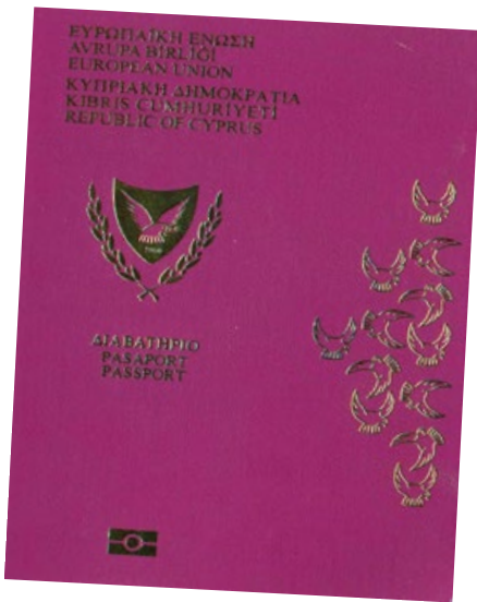
▲ 塞浦路斯黄金护照

美国国务卿蓬佩奥已宣布美国将在年底前彻底关闭在美所有的中共红色大外宣——孔子学院。同时，美国的教育界、科技界已经加大力度限制中共留学生赴美。据外媒报道，2018 年 5 ~ 9 月，获得美国商务、休闲和教育签证的中国公民比前一年减少 10 万多人，下降 13%。2020 年 6 月份只有 8 名中国学生获得赴美的学生签证，8 人获得访问学者签证。与之相比，2019 年 6 月