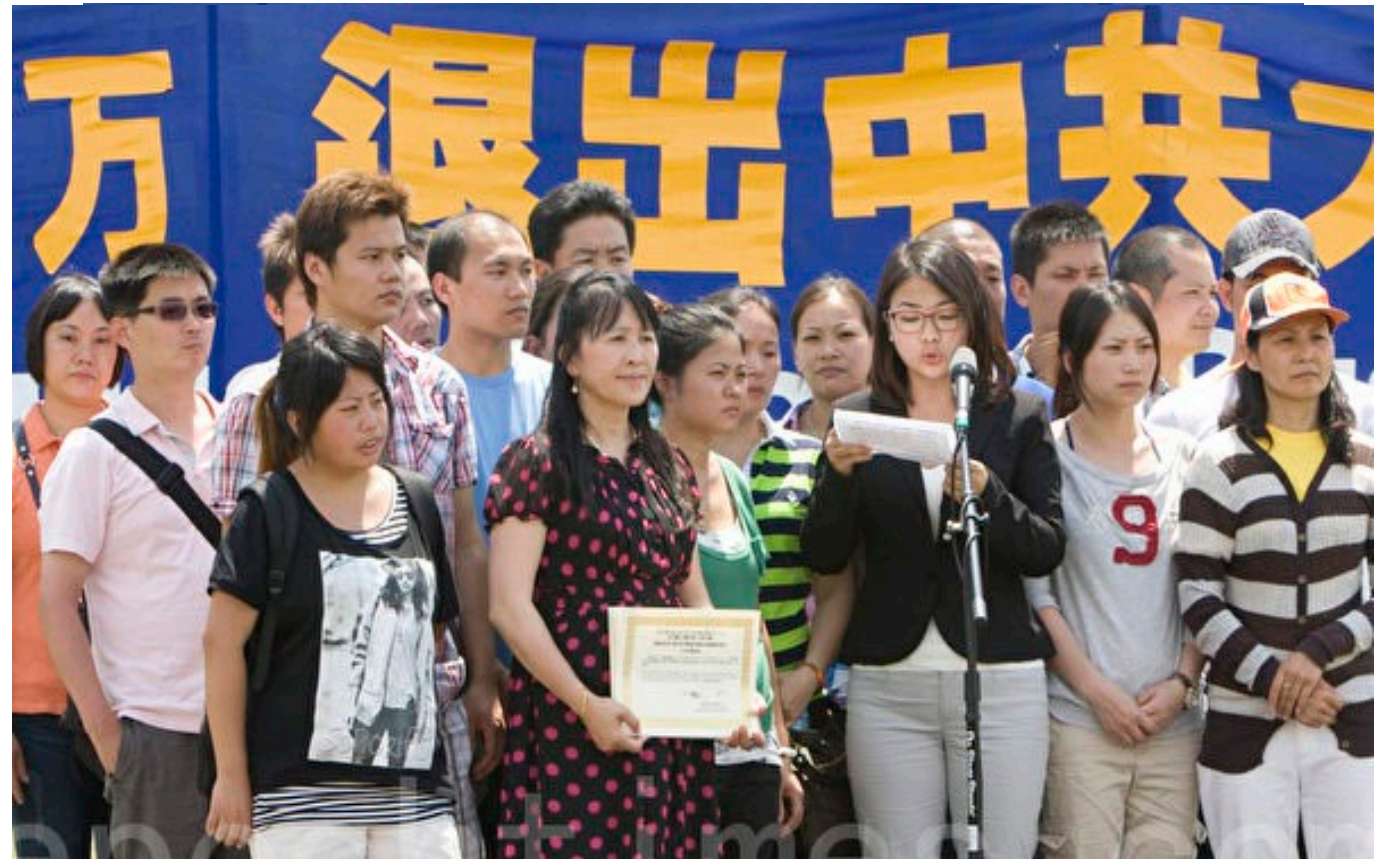
▲ 2020 年 7 月 13 日，在美国首都华盛顿，在美国的华人现场退党，并领取全球退党服务中心颁发的退党证书。

众所周知，在中国，所有组织和团体章程的第一条都是拥护共产党的领导，如妇联、工会、