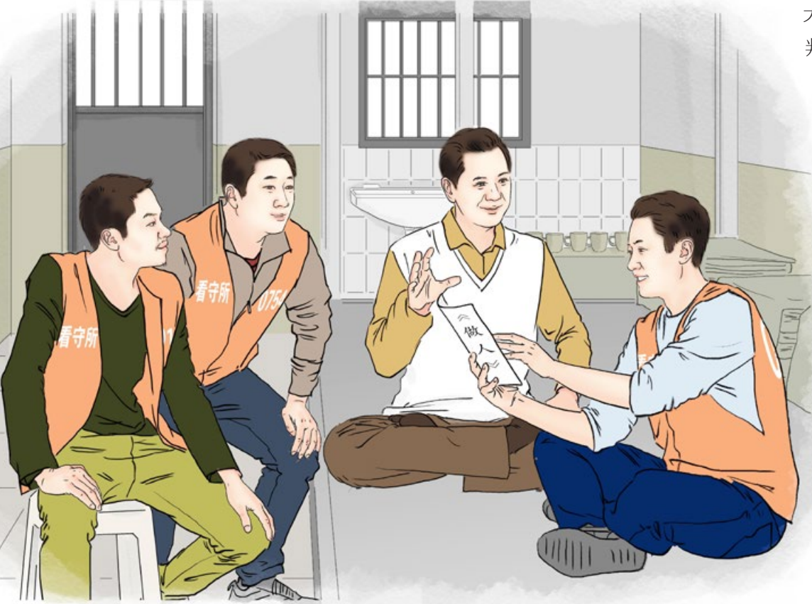
《狱中得法》 绘画：善玉

出来以后，才知道我是取保候审的，可能还会被判刑。我看到了母亲和她的同事来接我，母亲哭得像个泪人一样。此时，我