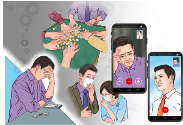
《舅舅身上的奇迹》 绘画：善玉

我看他那么无奈和沮丧的样子，就跟他说：“你要发财，我没办法；要升官，我没有办法；但保平