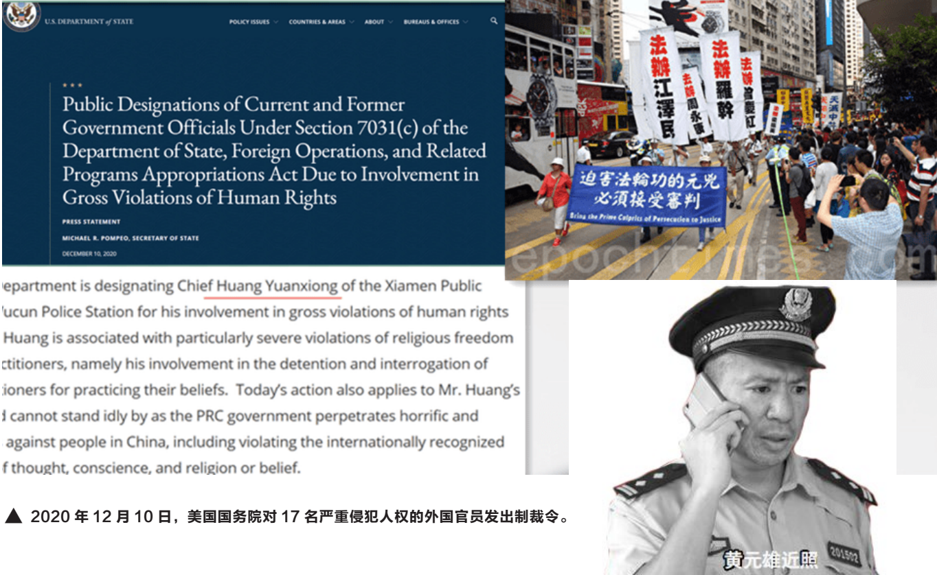
▲ 2020 年 12 月 10 日，美国国务院对 17 名严重侵犯人权的外国官员发出制裁令。