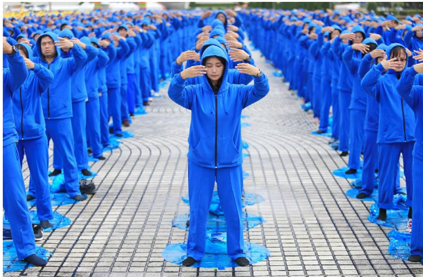
▲ 2020 年 12 月 5 日，约 5400 名来自台湾各地的法轮功学员，齐聚在台北中正纪念堂的自由广场，排出“法轮大法好 真善忍好”九字真言，并进行集体大炼功。