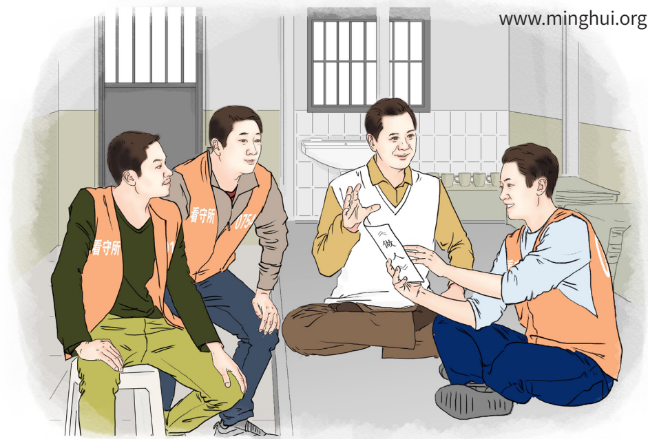
《狱中得法》 绘画：善玉

六亲不认 为情者自寻烦恼 苦相斗造业一生”。想想自己经历的爱情、亲情、金钱转眼成空，觉得这诗写得太对了。