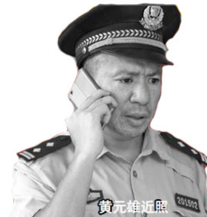
▲ 2020 年 12 月 10 日，美国国务院对 17 名严重侵犯人权的外国官员发出制裁令。

卿表达感谢，因为今年‘7·20’的时候，他是第一位美国国务卿，对法轮功过去 20 多年的受迫害，发表正式声明，谴责迫害；另外也提到活摘器官的问题。他也非常重视这个事情。德斯特罗助理国务卿，也正在处理这个事情。”