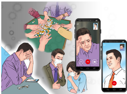
《舅舅身上的奇迹》 绘画：善玉

“我舅舅和舅妈都是武汉的医生，因不知疫情真相，参加聚餐和打麻将，1月23日开始发烧……他俩得了‘武汉肺炎’，非