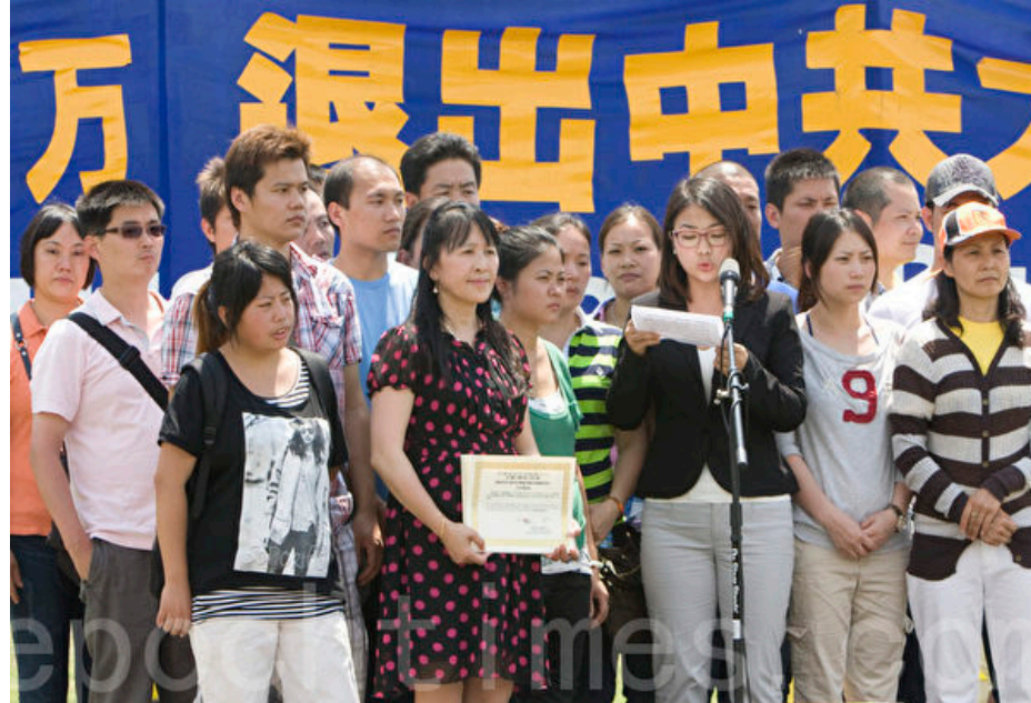
▲ 2020年7月13日，在美国首都华盛顿，在美国的华人现场退党，并领取全球退党服务中心颁发的退党证书。

等，这些大多由中共党员领导，被认为具有推动某一政治议程的任务，实际上也是共产党的外围组织。