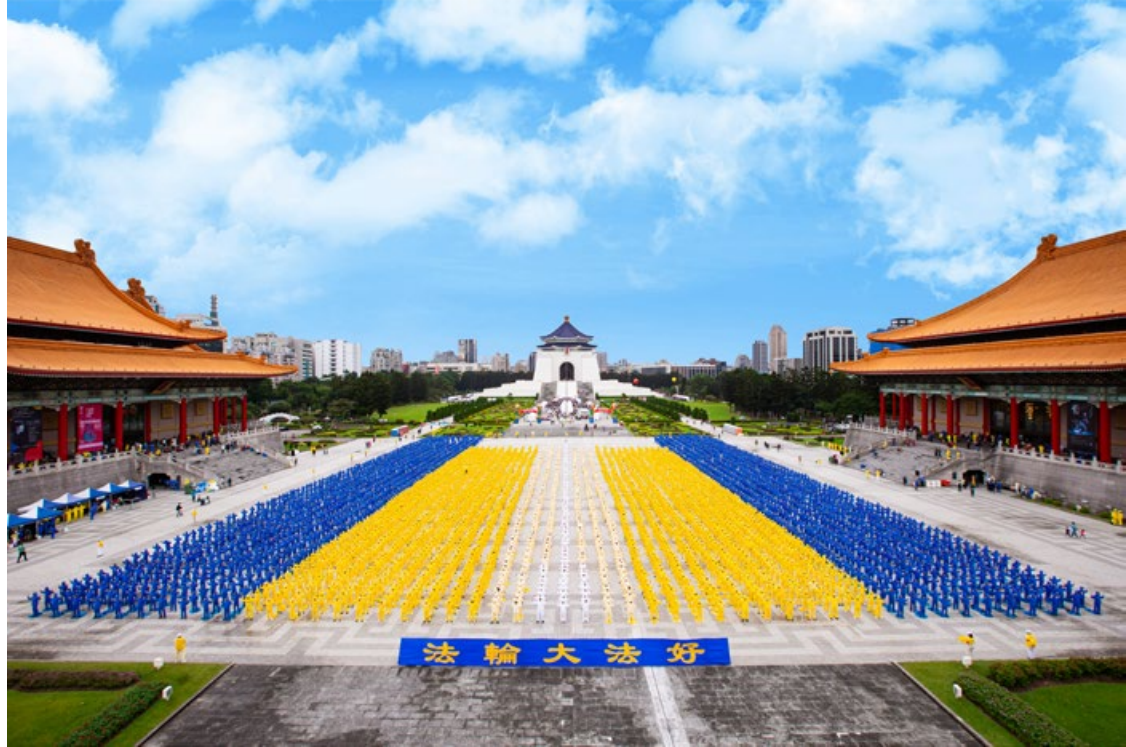
2019年11月16日，约6500名法轮功学员在台湾台北自由广场集体炼功。