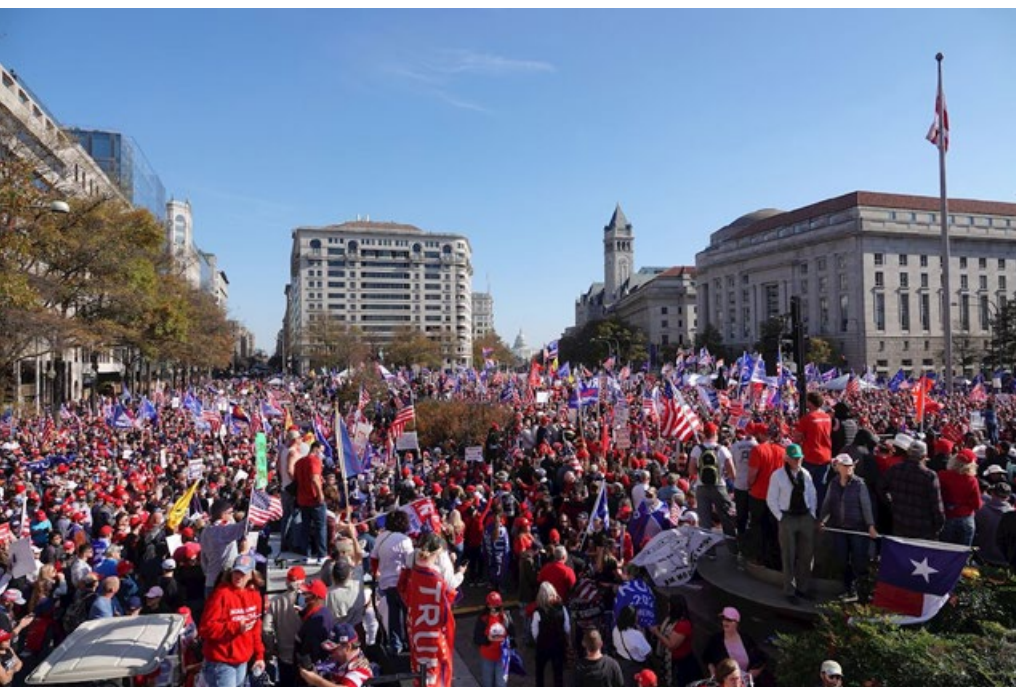
2020 年 11 月 14 日，在华盛顿 DC，呼吁“停止窃选”、“百万人支持川普”大型集会游行。

而拒绝共产主义的行动也从未停止过：从上个世纪九十年代东欧共产主义政权解体，到苏共政权的轰然倒塌，再到今天美国人民拒绝共产主义的渗透，认清共产主义本质的人们都在向共产主义说“不”！