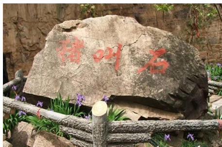
太行山脚下的“猪叫石”。

每当世间有大事发生前，这块“猪叫石”就会发出猪叫般的声音，数百年来，屡验不鲜。据当地人介绍，清廷入关，八国联军侵华前“猪叫石”发声；日本侵华前，猪叫石连叫数月；1949年中共窃政前、文革前、1976