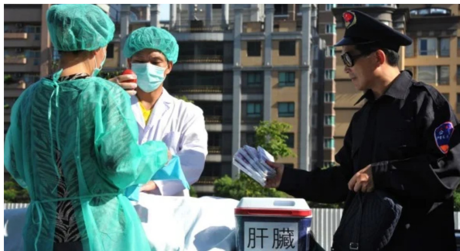
法轮功学员在演示中共活摘器官。

2月11号,英国的《药品和医疗器械法案》(Medicines and Medical Devices Bill)修正案正式成为法律。这个修正案确保从海外进口的人体组织、器官和细胞等不能进入英国医疗界,明确抵制中共强摘良心犯器官的罪恶。