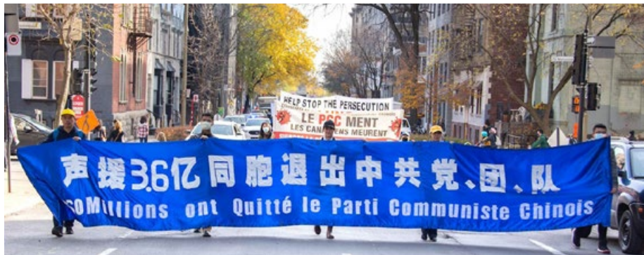
▲ 2020年11月7日,加拿大魁北克法轮功学员大游行。