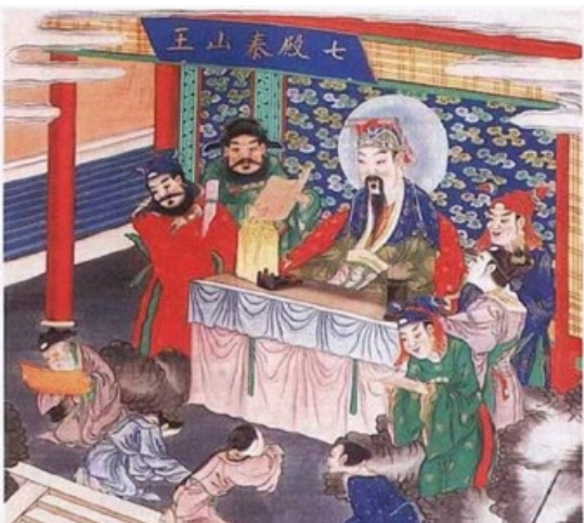
叶诸梁做梦到了阴司