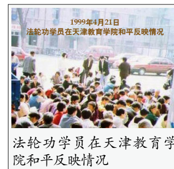
法轮功学员在天津教育学院和平反映情况

1999 年 4 月 11 日，中国科学院院士何祚庥，在天津教育学院主办的杂志上发表了污蔑法轮功的文章。因此，4 月 18 日至 24 日，一些法轮功学员前往天津教育学院及相关机构反映实情。起初院方承诺尽快更正，挽回影响，但在 4 月 23 日，天津市公安局却突然出动 300 多名防暴警察，殴打并抓捕了 40 多名法轮功学员。当法轮功学员要求放人时，得到的答复是：“我们是执行北京的命令，你们要反映情况就去北京吧。”