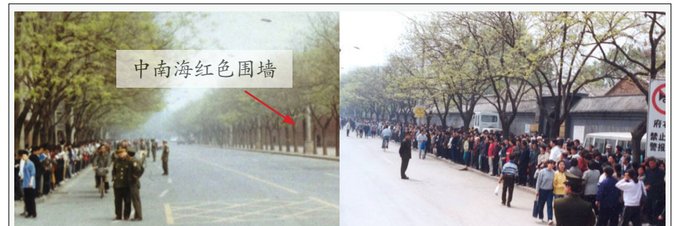
当年“四·二五”上访现场