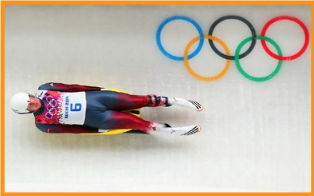
▲ 2014 年 2 月 8 日，鲁本尼斯在索契冬奥会男子单人无舵雪橇的比赛中。