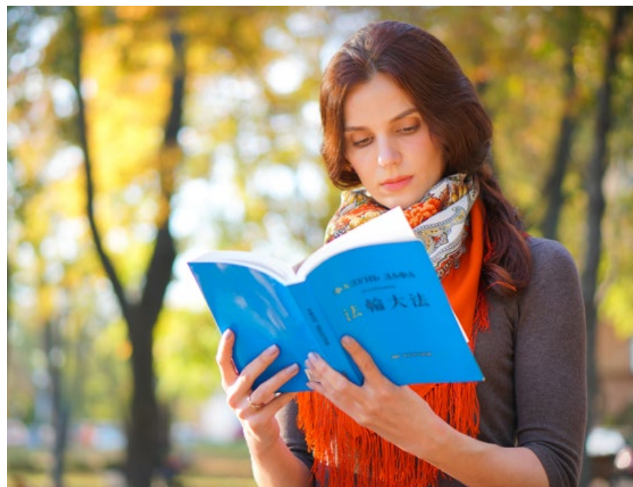
▲ 法轮功学员在阅读法轮功主要著作《转法轮》。

法轮功自 1992 年 5 月 13 日由李洪志先生从中国长春传出，以简明的法理和祛病健身的奇效吸引了无数有识之士，至今弘传世界 100 多个国家，获各国政府褒奖、支持议案、支持信函 4800 多项，有上亿人修炼。法轮功主要著作《转法轮》已出版发行 40 多种文字的版本。法轮大法的各种书籍，可以在法轮大法网站 FalunDafa.org 免费下载（需突破网络封锁，破网方法见封底）。◇