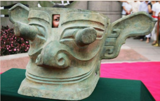
▲ 2005 年 6 月 15 日，四川广汉三星堆博物馆陈列的青铜纵目面具。