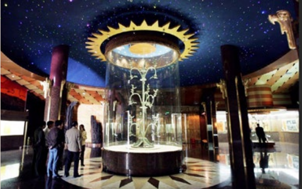
▲ 2005 年 4 月 13 日，四川广汉三星堆博物馆陈列的青铜神树。

总之，用“史前文化”的历史观来理解，才能圆满解释三星堆文化现象，也才能更好地理解世界多个地方发掘出来的其它文明古迹。无论如何，三星堆文化都将使人们重新认识人类的历史与起源问题，后续的发掘与研究情况如何，我们拭目以待。◇