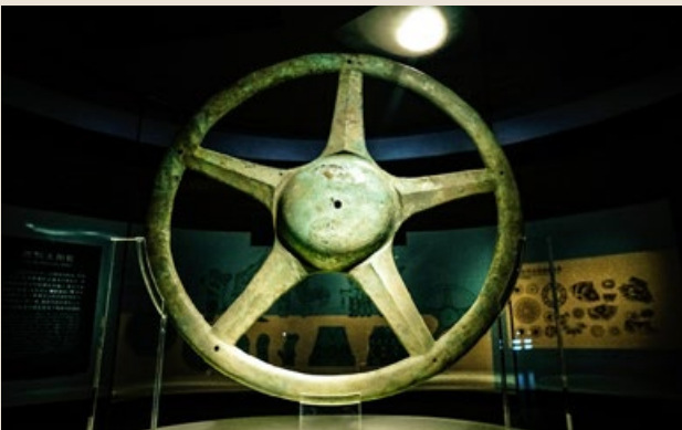
▲ 四川广汉三星堆出土的太阳轮