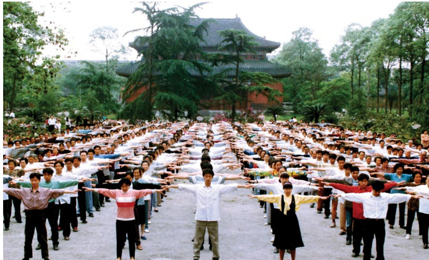
▼ 1999年前成都法轮功学员在集体炼功。

所以，很多问题，特别是关于宇宙、神、气功、修炼等久远而深奥的问题，我们真的需要多换一些角度，去重新思考。◇