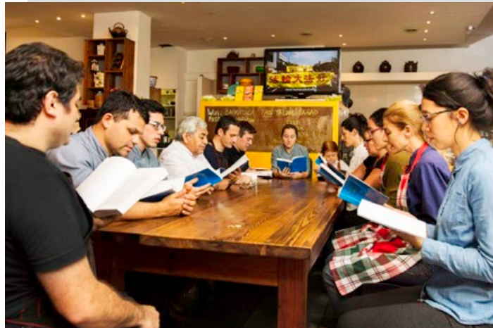
▲ 餐馆的员工每天一起阅读《转法轮》。