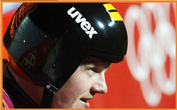
▲ 2006 年 2 月 12 日，鲁本尼斯在都灵冬奥会比赛中。