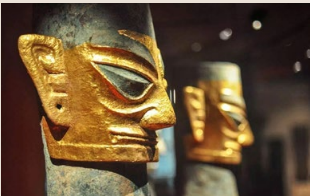
▲ 四川广汉三星堆出土的贴金青铜面具