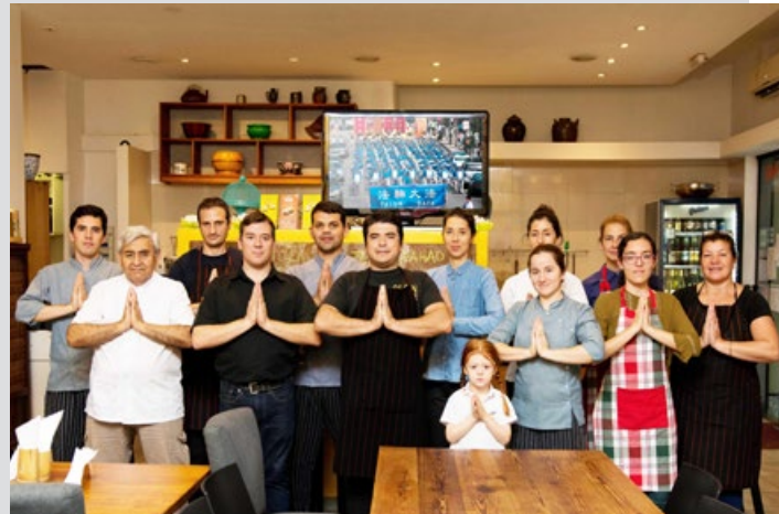
▲ 在餐厅工作的法轮功学员向李洪志师父问好。

谢谢师父”，并说，中国达喀尔团队知道法轮大法，而且作为中国人，在这里可以自由表达意见，这对我们来说是一个非常愉快的经历。