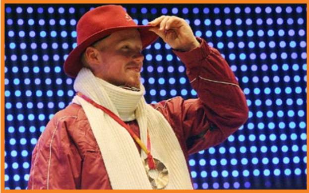
▲ 鲁本尼斯在 2006 年都灵冬奥会的颁奖仪式上。