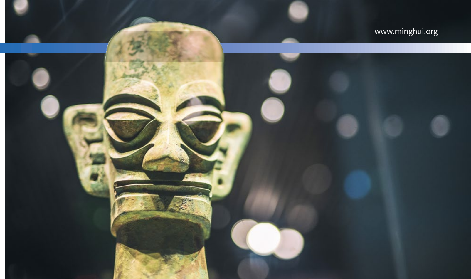
▲ 四川广汉三星堆出土的青铜人头