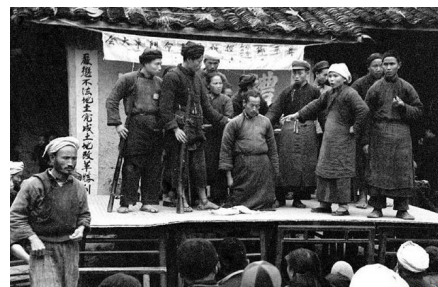
▲ 历史图片：土改运动斗地主