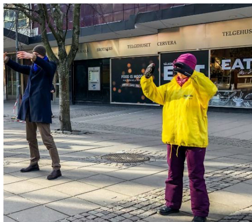
图 1：路人驻足观看学员炼功、阅读真相展板

活动结束前，这群年轻人又返了回来，向学员表示：“感谢你们告诉了我们真相，希望在南泰利耶能常常看到法轮功。”