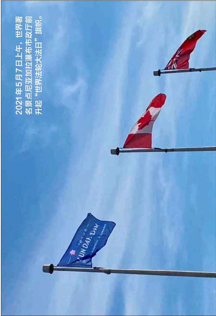
2021年5月7日上午，世界著名景点尼亚加拉瀑布市政厅前升起“世界法轮大法日”旗帜。