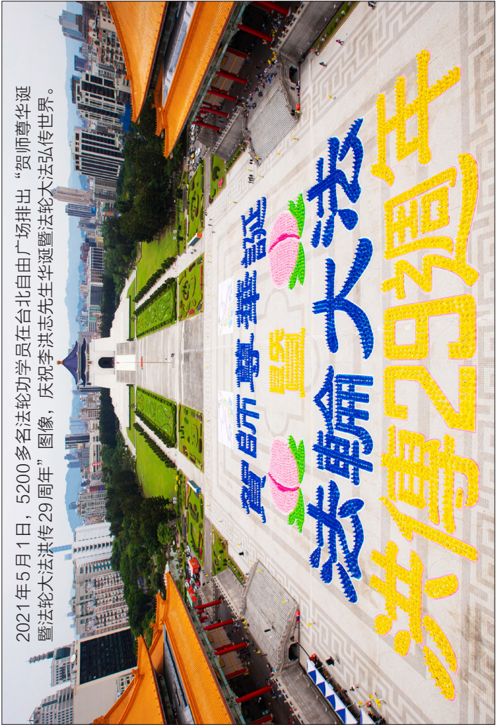
2021年5月1日，5200多名法轮功学员在台北自由广场排出“贺师尊华诞暨法轮大法洪传29周年”图像，庆祝李洪志先生华诞暨法轮大法弘传世界。