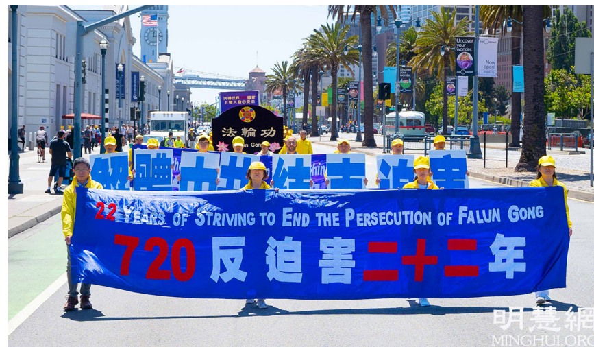
2021年7月17日，美国旧金山湾区的法轮功学员举行集会和盛大游行，谴责中共对法轮功的迫害，并呼吁解体中共，结束迫害。

二十二年来，面对中共持续的残酷打压，全世界法轮功学员虽然历经着常人难以想象的困难与艰辛，但依旧坚持和平反迫害，赢得了各国各界的广泛赞誉，也让越来越多的世人明白真相，认清了中共真实面目。