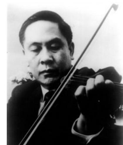
著名音乐家马思聪。

另一位钢琴天才顾圣婴，在上海交响乐团担任独奏。文革开始后，顾圣婴一家遭到残酷迫害。1967年1月31