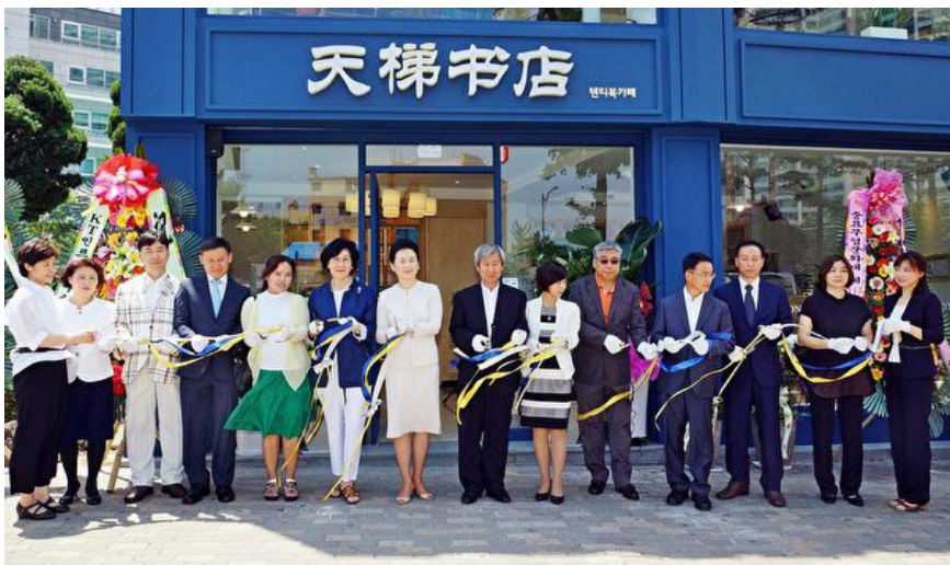
2015年7月1日，天梯书店亚洲第一分店在韩国首尔开业。图为当天的开业剪彩仪式。