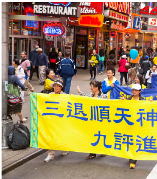
2016年5月13日，美国纽约上万人游行庆祝第“评进户福德随”的横幅。