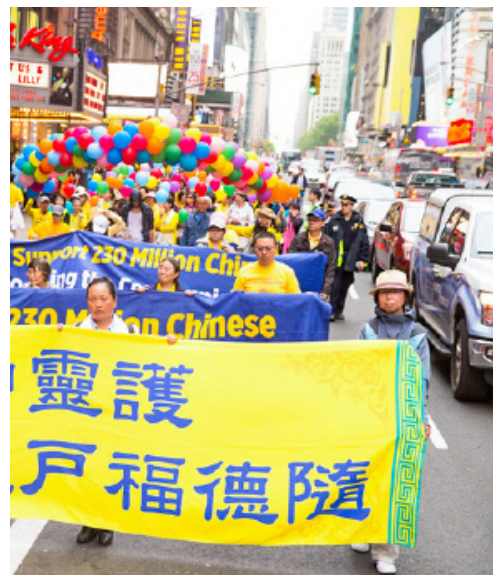
17届法轮大法日。图为“三退顺天神灵护 九

永明把“三退”这件事看成是他人生的一个关键转折点,还说:“这是我花钱烧香求卦都求不来的大好事呀!”