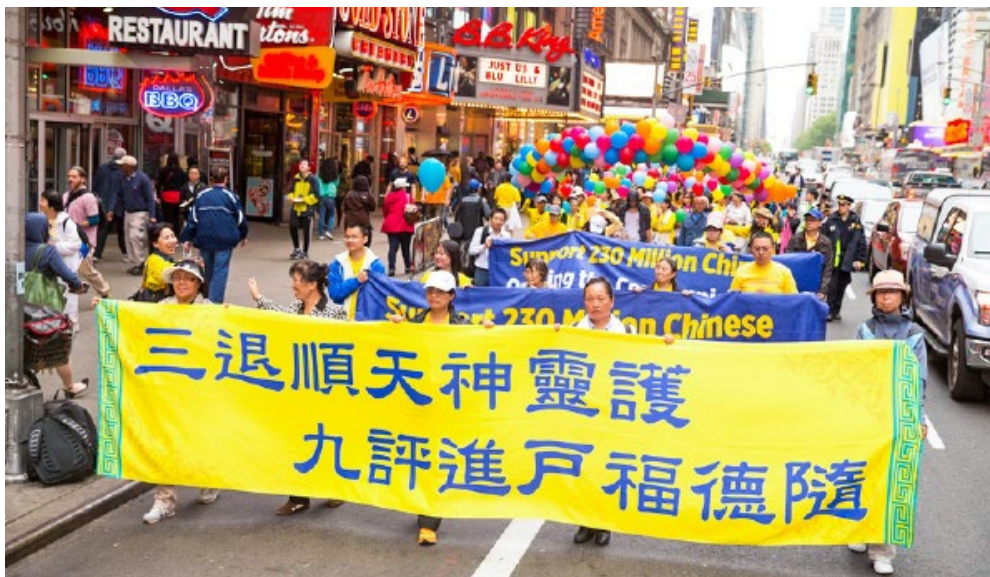
2016年5月13日，美国纽约上万人游行庆祝第 17届法轮大法日。图为“三退顺天神灵护 九评进户福德随”的横幅。

的永明说：“好在你‘三退’了，老天真关照你了！不然你可能也成车难鬼了！”永明听后庆幸地笑了，笑得很开心。老洪知道后，领着家人到永明家做客，帮助永明的妻子与他上中学的女儿也一起“三退”了。