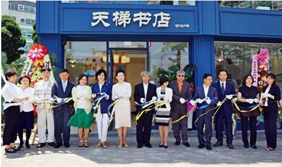
2015年7月1日，天梯书店亚洲第一分店在韩国首尔开业。图为当天的开业剪彩仪式。