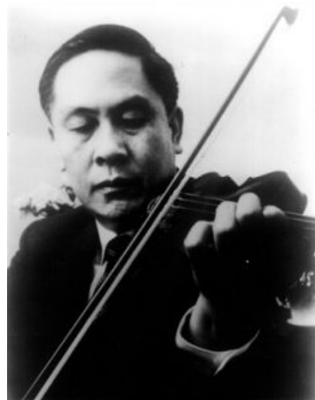
著名音乐家马思聪。