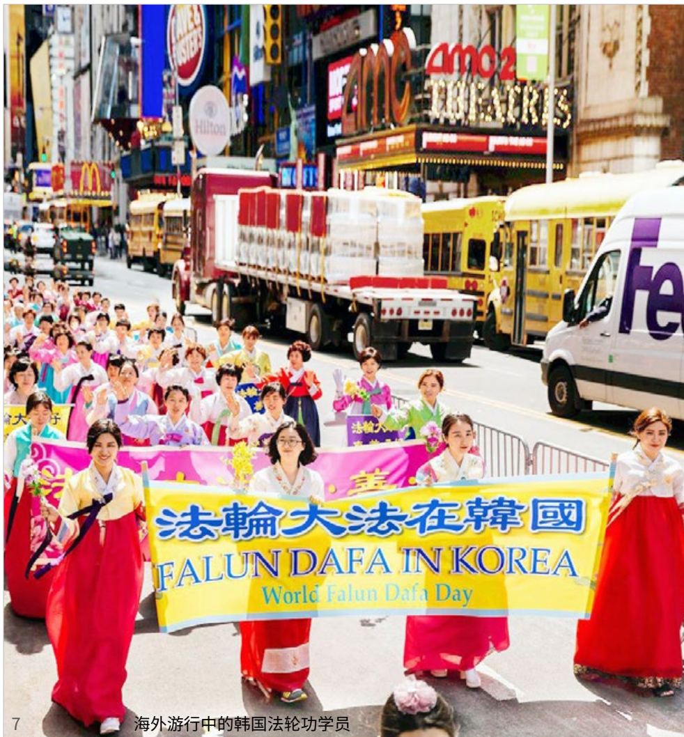
7 海外游行中的韩国法轮功学员