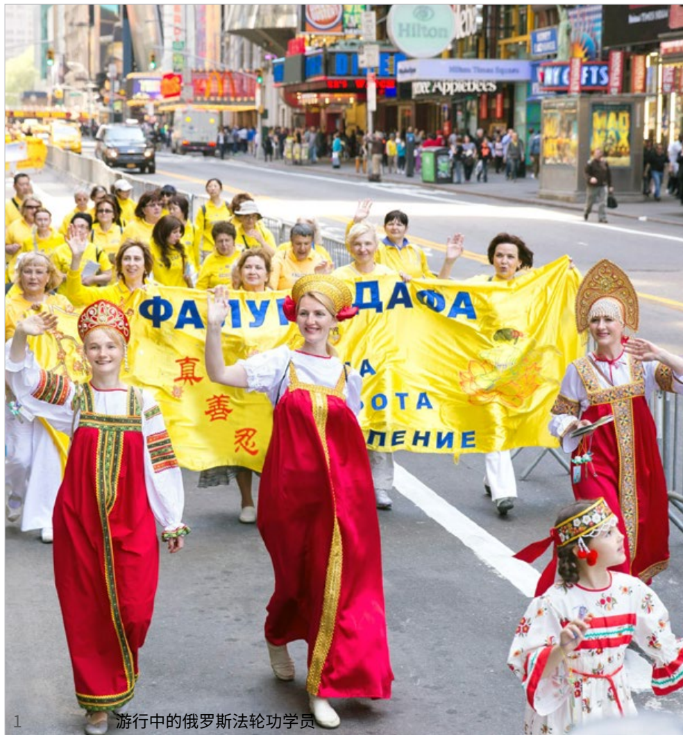
1 游行中的俄罗斯法轮功学员