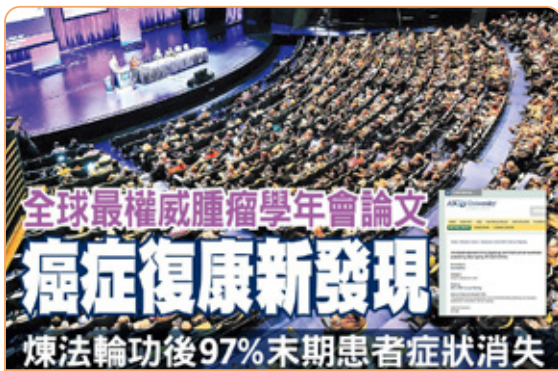
◎ 美国临床肿瘤学会年会上，癌症末期患者修炼法轮功后痊愈的研究成果令国际医学界关注。