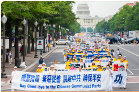
◎ 法轮功学员游行队伍浩浩荡荡穿越美国华盛顿中心大道，告诉大陆同胞赶快退出中共。

几天后，乡书记看了《九评共产党》，也有了那种恍然觉悟的感觉。他找到炼法轮功的同学了解真相，同学给他讲了三个小时。这次他是明白了，用一个很吉祥的化名做了“三退”。