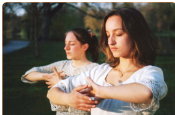
◎ 胡伯特全家六口都修炼，被称为“法轮大法之家”。姐妹俩在炼法轮功第四套功法。