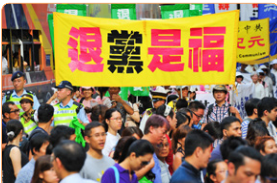
◎《九评》揭露了中共“假恶暴”的本质，引发“三退”大潮。“退党是福”成为大陆流行语。