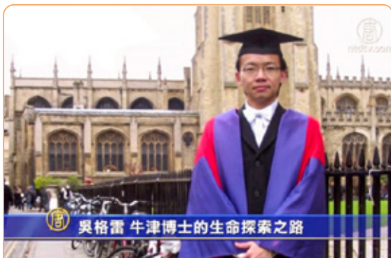
◎ 格雷说：修心炼功，我多年的胃病痊愈了；精神状况也变得非常好，有充沛的精力做研究。