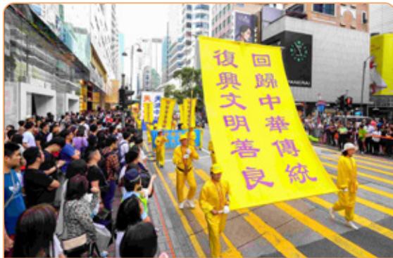
◎ 香港法轮功学员壮观的游行队伍，吸引众多大陆游客驻足观看，人们纷纷拍照留念。

但是，只把五星血旗烧掉了还不行，还不算彻底，怎么办？做“三退”，从心里到行动都远离中共，抛弃它，不要它，它就不会祸害到你，你就幸福平安了！戴红领巾的孩子，从心里退出少先队，那个红领巾上面的血腥之气就不起作用了。