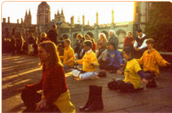
◎ 剑桥大学国王学院楼前广场上，法轮功学员晨炼的身影，给这所著名学府带来了勃勃生机。

全世界几乎所有的国家都赞成修炼法轮功，为什么只有中国大陆不允许？如果真像中共所抹黑宣传的那样，那为什么没有第二个国家禁止学炼呢？人啊，应该用自己的头脑去辨析。