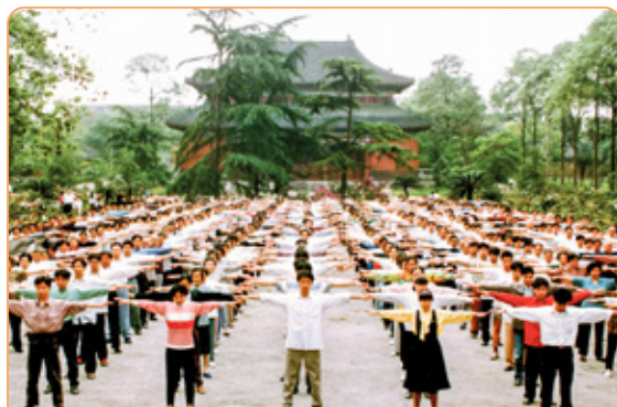
1999 年，成都法轮功学员晨炼。中共发动迫害之前，这样的炼功场景在大陆到处可见。