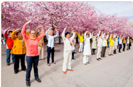
◎ 瑞典法轮功学员在皇家花园美丽的樱花树下集体炼功，祥和的场面成为一道靓丽的风景。