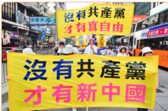
◎ 越来越多的善良、正义之士都看清了一个真理：“中共不等于中国”“爱国不等于爱党”。