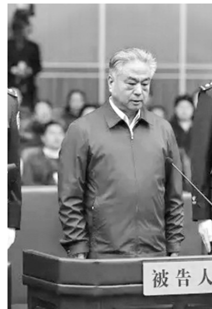
引发法轮功万人和平上访的天津市公安局局长武长顺，2017年被判死缓，终身监禁不得减刑和假释。

市大街小巷再次传出鞭炮声，亦有大量市民吃喜面庆祝。丧事被百姓当作喜事办，也是张立昌的另类报应吧。