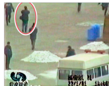
“自焚”属突发事件，又在敏感之地天安门，一般人无法在警察身边近距离拍摄。但央视自焚节目中，却有大量远景、近景和特写镜头，还可看到一名背摄影包的男子，在军警中间自由拍摄。