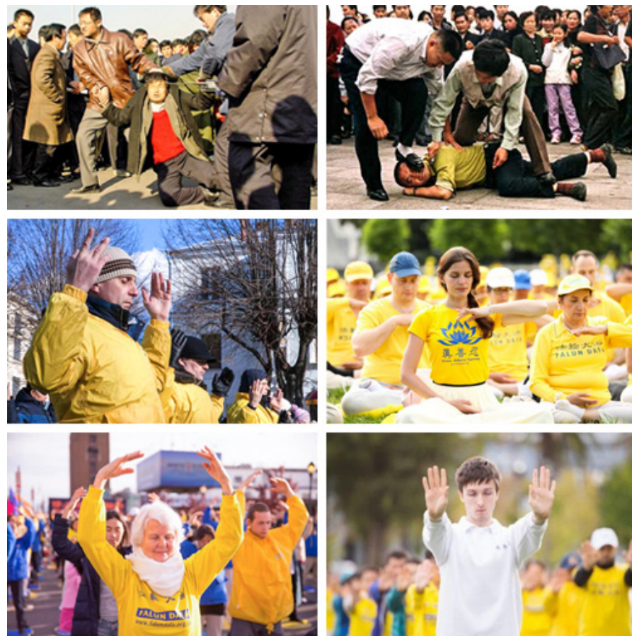
法轮功弘传世界 100 多个国家，只有在中国大陆受到迫害。

中共有法不依，也运用到了其他人身上。中共破坏法治不仅伤害法轮功学员，也危害每个人，中国人民的合法权利没有保障。只有抛弃中共，才能让中国真正实行依法治国，才能匡复正义，还法轮功及其修炼者清白。◇