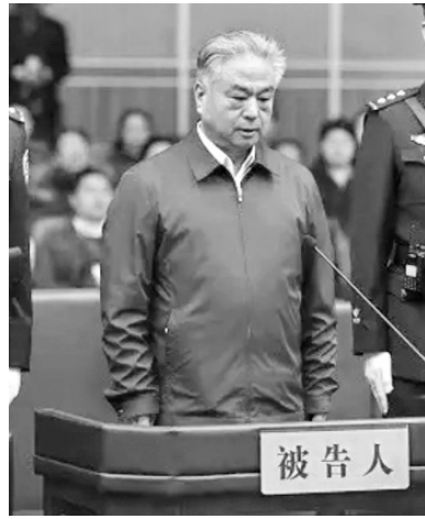
引发“四·二五”法轮功万人和平上访的天津市公安局局长武长顺，2017年被判死缓，终身监禁不得减刑和假释。

2007年宋平顺东窗事发后，武长顺被“双规”之说就在天津迅速蔓延，后来几年能化险为夷、青云直上、全面接替宋平顺，与周永康的庇护分不开。“不是