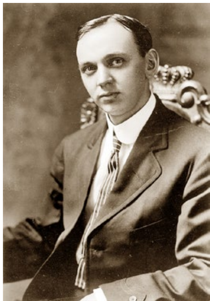
著名预言家埃德加·卡西

卡西在催眠状态下，回溯了瘫痪青年的前两世的转世情况。其中一世，罗马帝国迫害基督徒