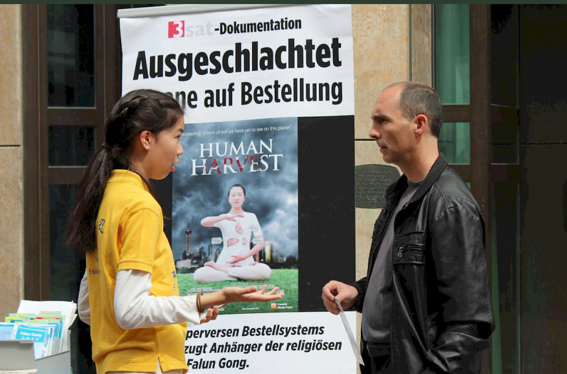
在瑞士的温特图尔市中心，市民震惊于江泽民的反人类罪行。