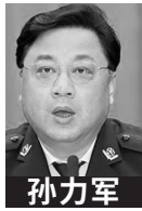
中央“610 办公室”头目相继落马。

9月22日，前司法部长、“610 办公室”头目傅政华，被判处死刑、缓期二年执行。