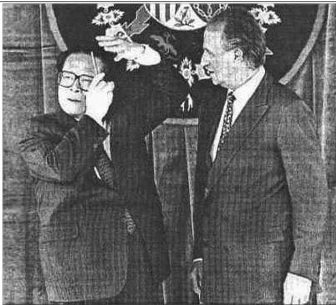
El Rey pide a China más derechos humanos El presidente de China, Jiang Zemin, visitó oficialmente España durante dos días. Ante el rey Carlos III, el líder chino se arregló el pelo con un peine.

西班牙国王邀请江泽民阅军，江突然掏出梳子，把公共场所当洗手间，搔首弄姿地梳起头来，国王震惊得合不拢嘴。1996年6月25日，西班牙第一大报《国家日报》头版头条刊出新闻图片“卡洛斯国王看江泽民梳头”。