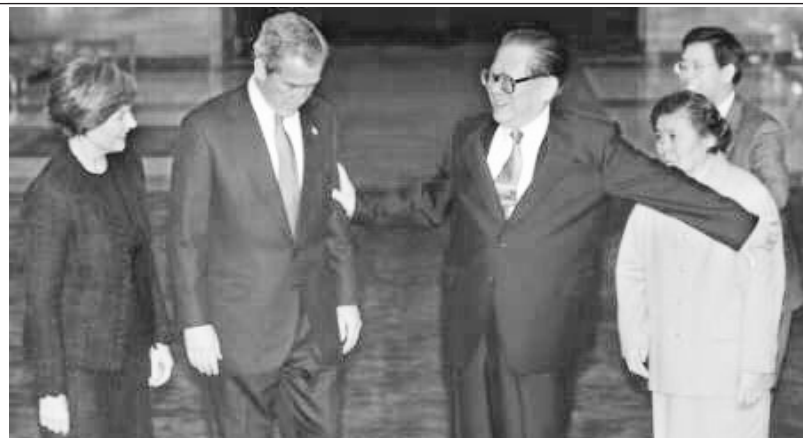
2002年，布什访问北京，江泽民本该将其妻介绍给布什夫人，江却伸出胳膊将妻子拦在身后，另一只手推开布什，场面尴尬。