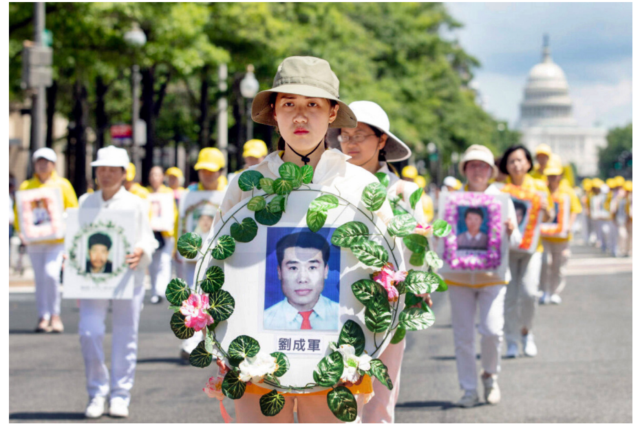
海外法轮功学员反迫害大游行，纪念被中共迫害致死的4800多名大陆法轮功学员。

江泽民不仅腐败治军，还色情祸国。江带头搞淫乱，民间顺口溜“家里养着猫头鹰，出国带着李瑞英，听歌要听宋祖英”以及“二英”在中南海