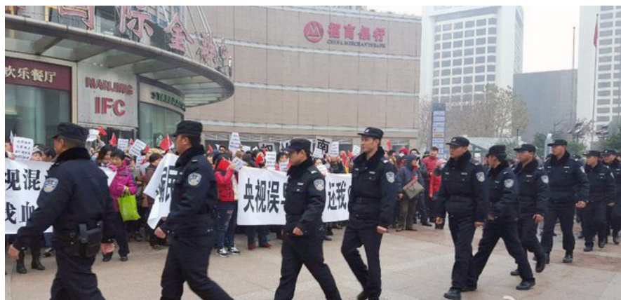
2015 年 12 月，中国 7 省 34 市的上万名 E 租宝投资人，分别在所在地追讨投资款，打出横幅“央视误导，还我血汗钱”。政府派警察镇压。

以养老金为例，百姓交的钱被贪污挪用，养老金缺口超过 10 亿元。股市、汇市、债市、期货，常仗以国家旗号进行非法操作，圈骗百姓的钱。中共不仅发给 E 租宝、P2P 网络借贷平台等各种金融理财公司合法的经营牌照，还直接出面糊弄百姓，造成一亿金融难民血本无归。中国就这样被掏空，百姓被榨干。◇