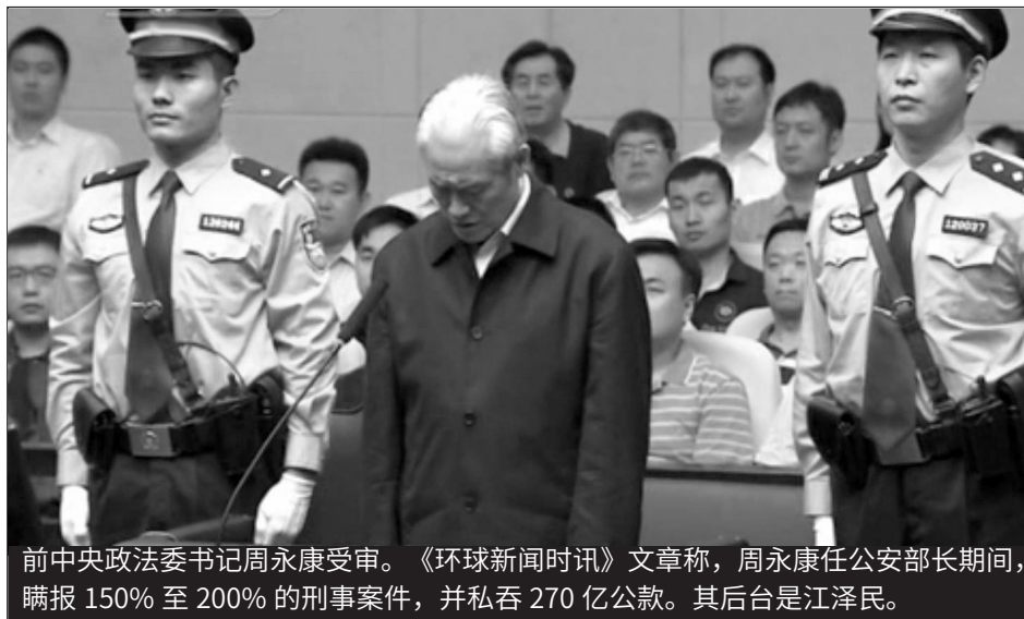
前中央政法委书记周永康受审。《环球新闻时讯》文章称，周永康任公安部长期间，瞒报 150% 至 200% 的刑事案件，并私吞 270 亿公款。其后台是江泽民。