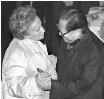
1999年，江泽民参观法国博物馆时，突然拉住法国总统夫人跳舞。