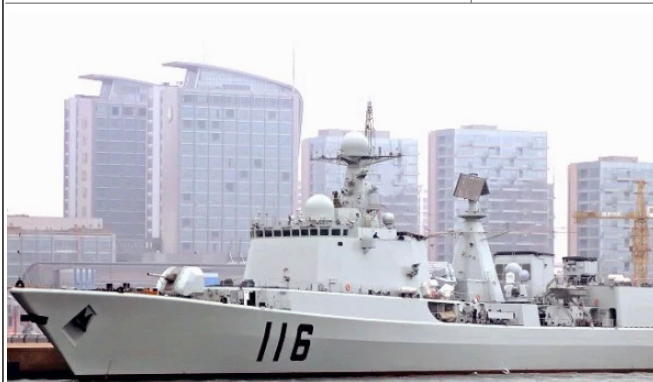
江泽民治下的海军舰艇，公然为走私船护航。图为中国海军驱逐舰。

“在楼上呆了十多分钟，我又去三楼找孙立东。在三楼的楼梯处听见孙在二楼喊：另一个屋里别打了！有人出来问怎么回事，他说‘这屋死了’。我在二楼看见刘海波被从老虎凳上放下来了，躺在地上，人已断气。孙过来让给他穿衣服，几个人匆忙给穿也穿不上。这时老魏下来，正好赶上。孙让我们赶紧离开。他告诉艾力民别声张，他汇报上级去了。”