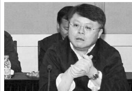
江泽民的儿子江绵恒是中国电信大王。

上海商界人士称，江绵恒的董事头衔多得数不清，上海重要经济领域他都染指。甚至上海过江隧道、上海地铁的董事会，他也有份。江绵恒既是中国电信大王，也是上海滩的大哥大。