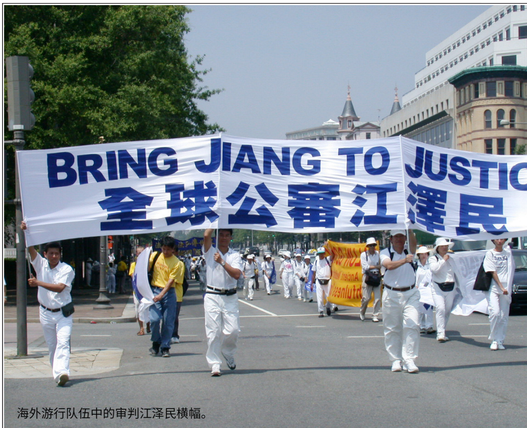
海外游行队伍中的审判江泽民横幅。