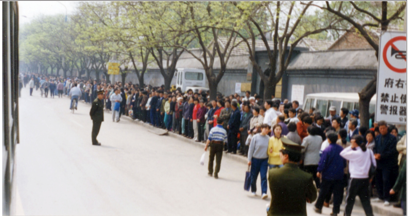
“4·25”大上访，现场文明安静，警察不用维持秩序。行人和车辆可正常通行。

23日和24日，天津市公安局动用防暴警察非法抓捕法轮功学员，致使学员流血受伤，40多人被抓。天津市政府表示，打压是北京的命令。学员被告知：公安部介入了此事，你们