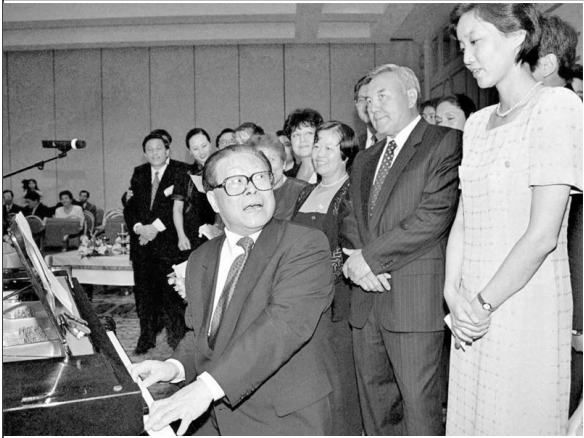
1998年，江泽民在哈萨克斯坦总统（右二）面前，弹唱起《可爱的一朵玫瑰花》，取悦女记者。