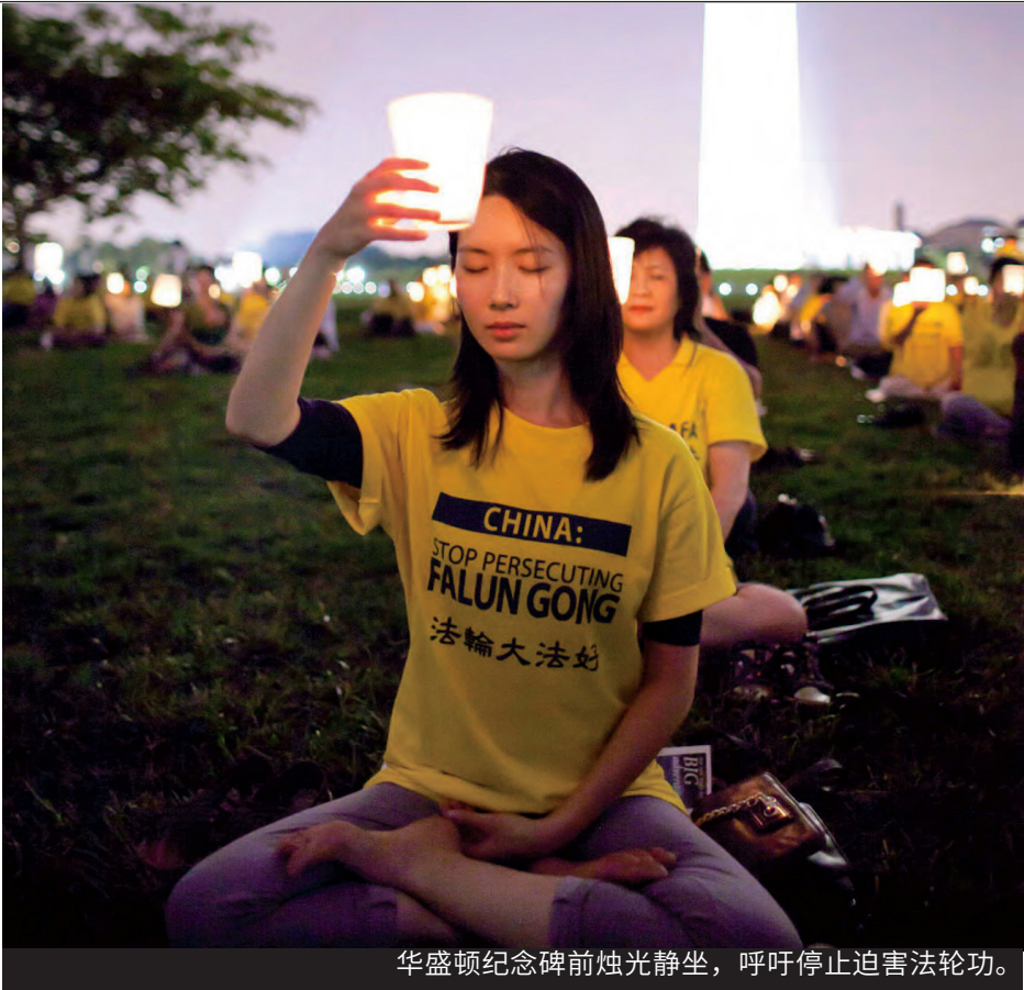
华盛顿纪念碑前烛光静坐，呼吁停止迫害法轮功。