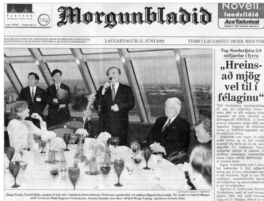
冰岛总统于 2002 年举办国宴，江泽民突然从餐桌旁起立献唱，令在场的宾主错愕，其妻王冶坪哭丧着脸。媒体以大幅照片详细报导，国际哗然。

原中央党校教授、红二代蔡霞，因不满中共体制而逃亡美国并公开承认，中共体制已成政治僵尸，她说：“中国经