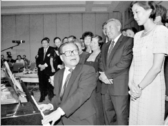
1998年，江泽民在哈萨克斯坦总统（右二）面前，弹唱起《可爱的一朵玫瑰花》，取悦女记者。