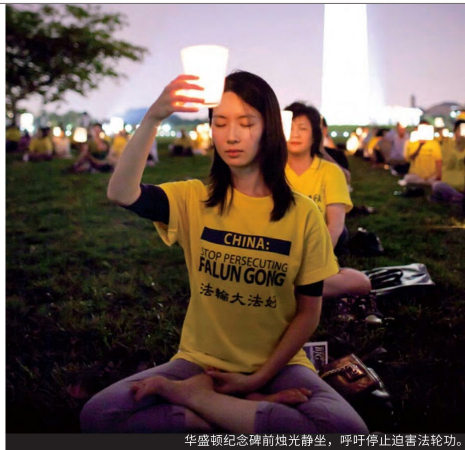
华盛顿纪念碑前烛光静坐，呼吁停止迫害法轮功。

以养老金为例，百姓交的钱被贪污挪用，养老金缺口超过 10 亿元。股市、汇市、债市、期货，常仗以国家旗号进行非法操作，圈骗百姓的钱。中共不仅发给 E 租宝、P2P 网络借贷平台等各种金融理财公司合法的经营牌照，还直接出面糊弄百姓，造成一亿金融难民血本无归。中国就这样被掏空，百姓被榨干。◇