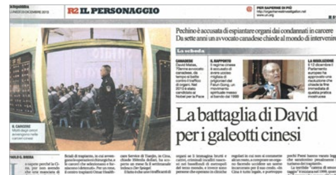
意大利《共和国报》报道江泽民集团强摘法轮功学员器官牟利。