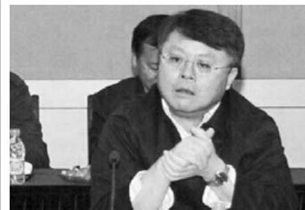
江泽民的儿子江绵恒是中国电信大王。

上海商界人士称，江绵恒的董事头衔多得数不清，上海重要经济领域他都染指。甚至上海过江隧道、上海地铁的董事会，他也有份。江绵恒既是中国电信大王，也是上海滩的大哥大。