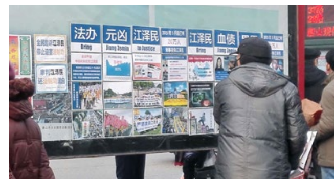
在中国大陆的城市乡村，揭露江泽民罪恶的真影展板引人注目。