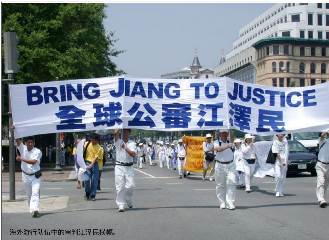
海外游行队伍中的审判江泽民横幅。