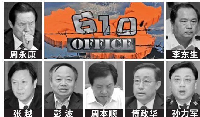
中央“610 办公室” 头目相继落马。