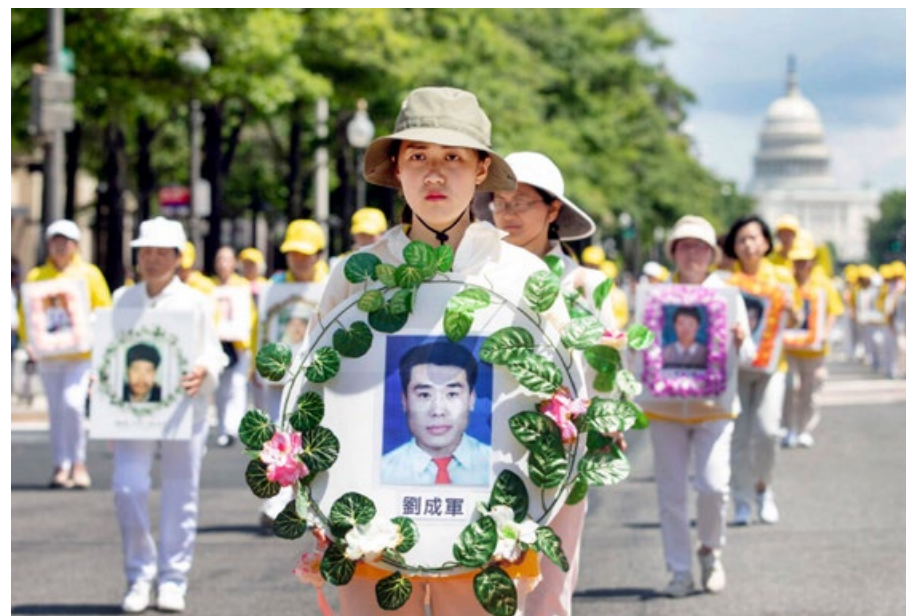
海外法轮功学员反迫害大游行，纪念被中共迫害致死的4800多名大陆法轮功学员。