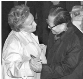
1999年，江泽民参观法国博物馆时，突然拉住法国总统夫人跳舞。