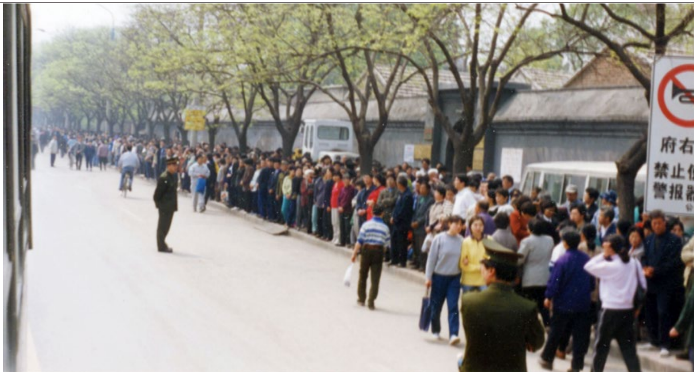
“4·25”大上访，现场文明安静，警察不用维持秩序。行人和车辆可正常通行。

23日和24日，天津市公安局动用防暴警察非法抓捕法轮功学员，致使学员流血受伤，40多人被抓。天津市政府表示，打压是北京的命令。学员被告知：公安部介入了此事，你们